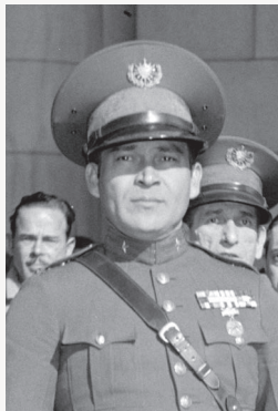
Fulgencio Batista | 1

Sovětský svaz z kosmodromu Bajkonur úspěšně vypouští družici Luna 1 – je to první objekt vytvořený člověkem, který unikl působení zemské přitažlivosti a vstoupil na oběžnou dráhu kolem Slunce.