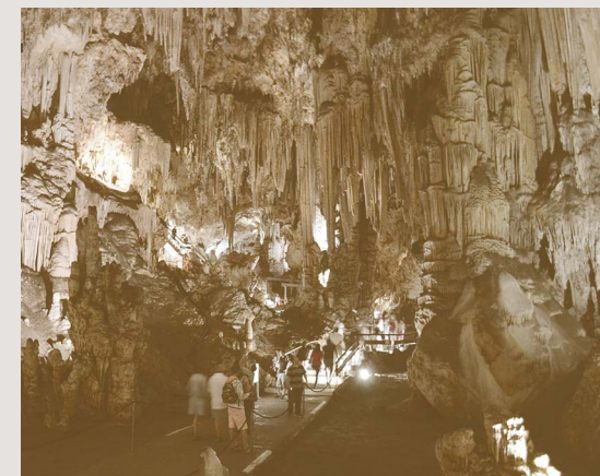
jeskyně Nerja | 12