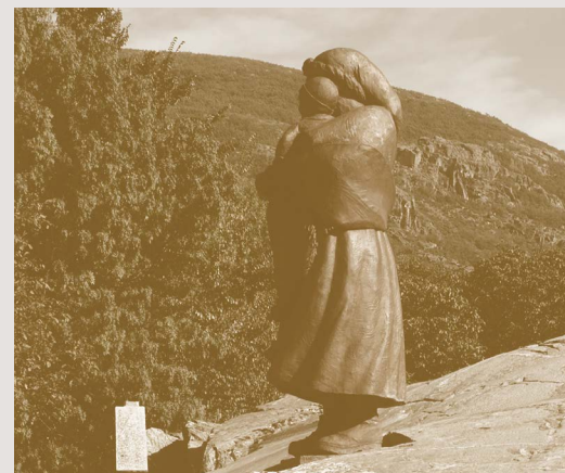
pomník obětem v Ribadelegu | 9