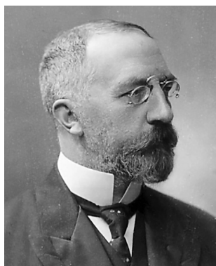
Karl von Stürgkh

Dne 7. července 1914 se uskutečnilo zasedání společné rakousko-uherské ministerské rady. Přítomni byli společní rakousko-uhersští ministři, oba mini-