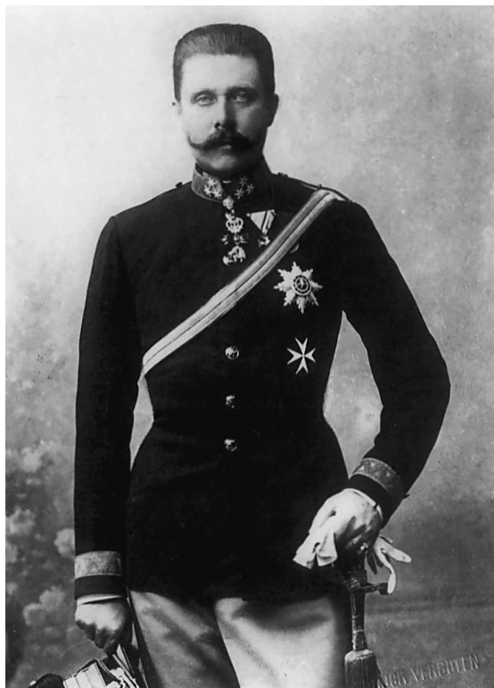
Následník trůnu František Ferdinand d'Este