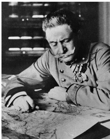
Franz Conrad von Hötzendorf

Srbská vláda ve skutečnosti za atentátem nestála a s největší pravděpodobností za ním nestála ani srbská tajná služba. Srbsko se v letech 1912–1913 zúčastnilo dvou balkánských válek, 2 které sice vyhrálo a rozšířilo svoje