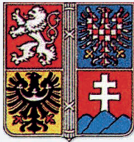
Znak Československej národnej rady (ČSNR)

Písomná zmluva uzavretá 30. mája 1918 medzi krajan-skými organizáciami v USA (Slovenskou ligou, Českým národným združením a Zväzom českých katolíkov) vyjadrujúca vôľu vytvoriť spoločný československý štát. Podpis pod dohodu pripojil aj TGM. Slovensku bola v zmluve prisľúbená rozsiahla samospráva. Malo získať vlastnú vládu, snem aj súdnictvo. Sľuby ale nakoniec neboli realizované, hoci sa mnohí slovenskí politici (vrátane Štefánika) po roku 1918 dožadovali ich splnenia. Po zvyšok 20. storočia, prakticky až do rozpadu Československa v roku 1992, dohoda predstavovala vďačnú tému pre česko-slovenské spory a diskusie. Časť Slovákov vnímala jej nesplnenie ako historickú krivdu. Česká strana zasa zmluvu často prehliadala ako „nevýznamnú“, ba dokonca „nezáväznú deklaráciu“, podpísanú len medzi krajan-ským spolkami v USA bez potrebnej „právnej sily“.