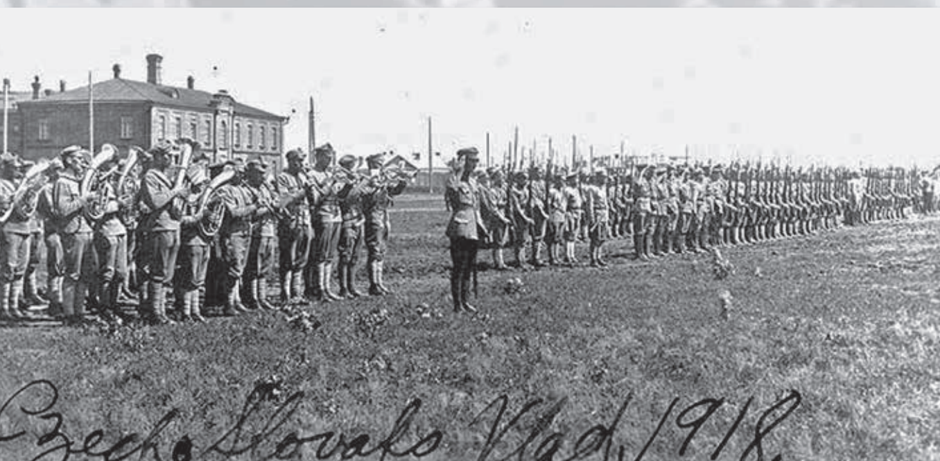
Cez dobrovoľnícke oddiely zostavené na území Ruska prešlo počas prvej svetovej vojny viac ako 60 000 Čechov a Slovákov