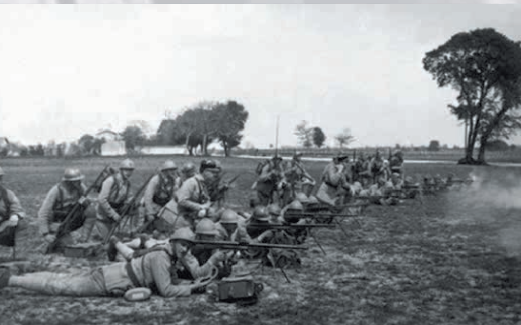
Náročný výcvik vo Francúzsku