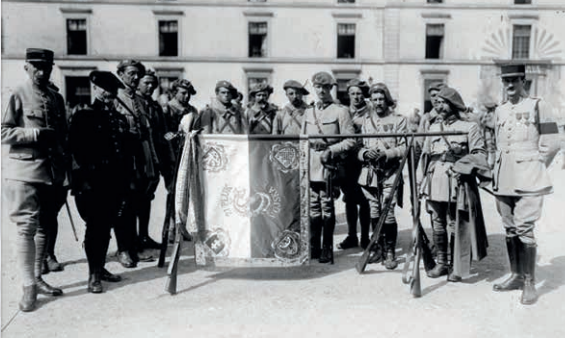
Skupinka legionárov vo Francúzsku v typických baretoch okolo národnej zástavy 14. júla 1918