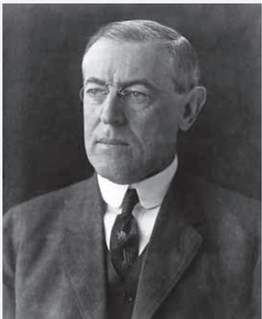
Veľký zástanca myšlienky československej samostatnosti v roku 1918, americký prezident Woodrow Wilson

TGM predčíta Filadelfské vyhlásenie z 26. októbra 1918. Zástupcovia amerických Rusínov sa vtedy vyslovili za pripojenie Podkarpatskej Rusi k vznikajúcemu Československu. Predtým, 18. októbra, sformuloval tiež Washingtonskú deklaráciu, v ktorej proklamoval československú samostatnosť a navrhol jej vnútorné usporiadanie ako zastupiteľskej demokracie a prezidentskej republiky podľa vzoru USA.