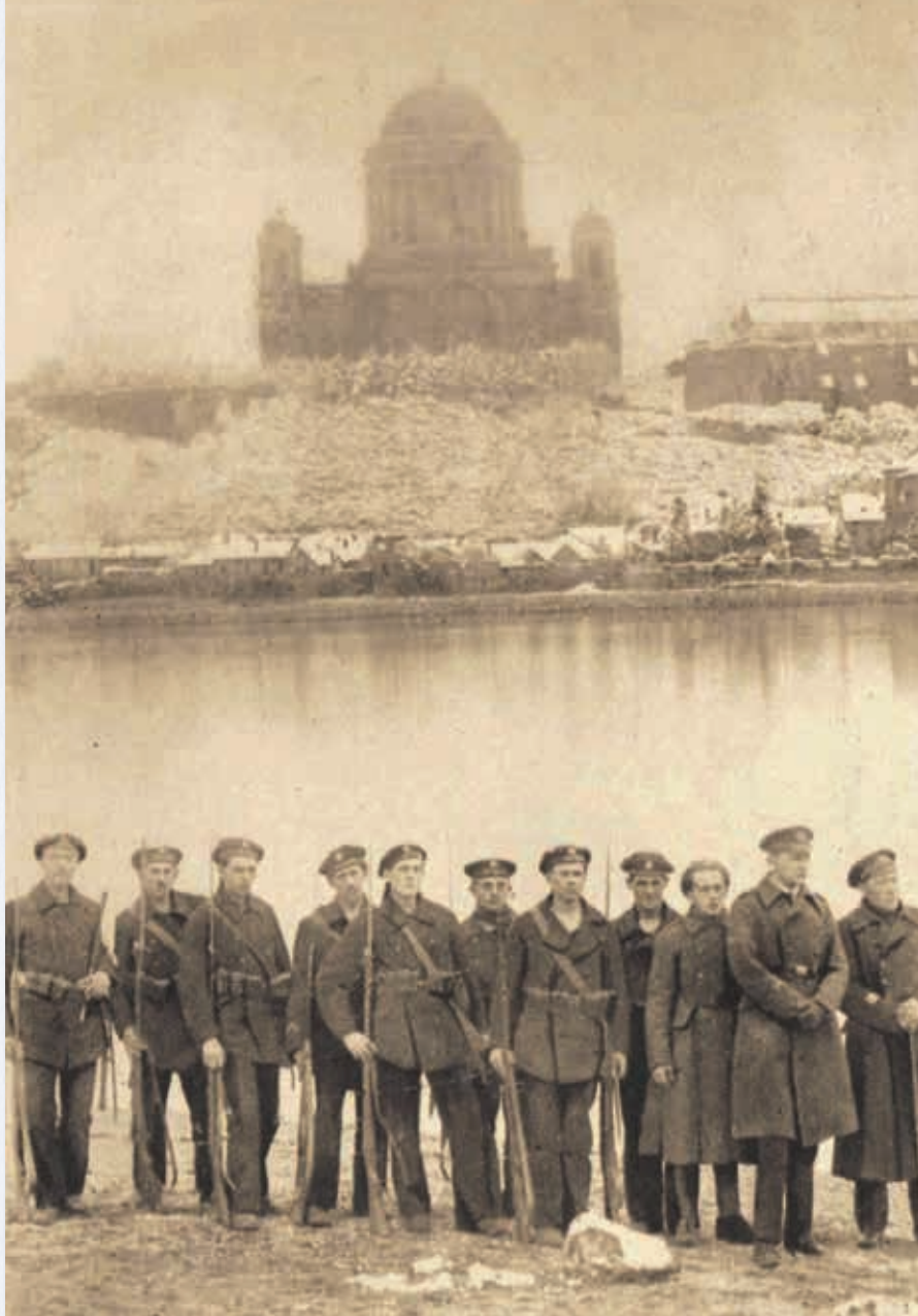
Oddiel československých námorníkov na brehu Dunaja. Za nimi na maďarskej strane katedrála v Ostrihome.