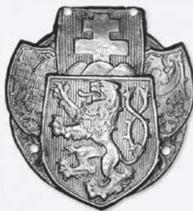
Znak československých légii

K medzinárodnému uznaniu Československa v lete roku 1918 zo strany dohodových vlád významne prispela existencia dobrovoľníckych jednotiek (tzv. légii), ktoré od roku 1917 podliehali politickej autorite Masarykovho exilu. Bojovali na strane Dohody vo Francúzsku, Taliansku a Rusku.