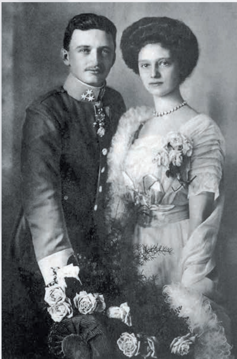
Snímka zachytáva novomanželov Karola a Zitu v roku 1911

V novembri 1918 bol zbavený trónu zákonom (sám neabdikoval). Zomrel predčasne v tridsiatich piatich rokoch v roku 1922 na Madeire.