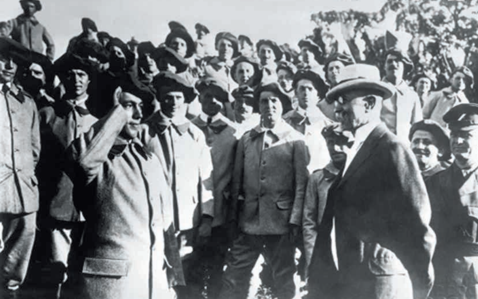
Návšteva TGM vo vojenskom tábore v Stamforde v USA, v ktorom boli regrutovaní dobrovoľníci pre československé jednotky v Európe, rok 1918

„Z VÍŤAZÍME, AK BUDEME MY ČESI A SLOVÁCI VŽDYCKY PO BOKU. KEĎ SA PODARÍ NIEKOMU NÁS ROZDVOJIŤ, POTOM BUDE S NAMI ZLE. V JEDNOTE JE SILA. PRVOU ZÁSADOU NÁŠHO BOJA JE JEDNOTA A SVORNOSŤ.“