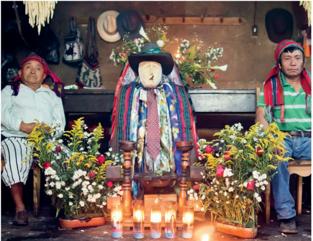
Mayský bůh Maximón se sombrem na hlavě, Guatemala

Přestože katolická víra dnes patří v Latinské Americe k nejrozšířenějším, i nadále v ní existují některá původní náboženství. V mnoha částech Guatemaly lidé stále uctívají Maximóna – tradičně oděného boha se sombrem na hlavě. Navštivte jemu zasvěcené oltáře, které jsou zdobeny cigaretami a rumem.