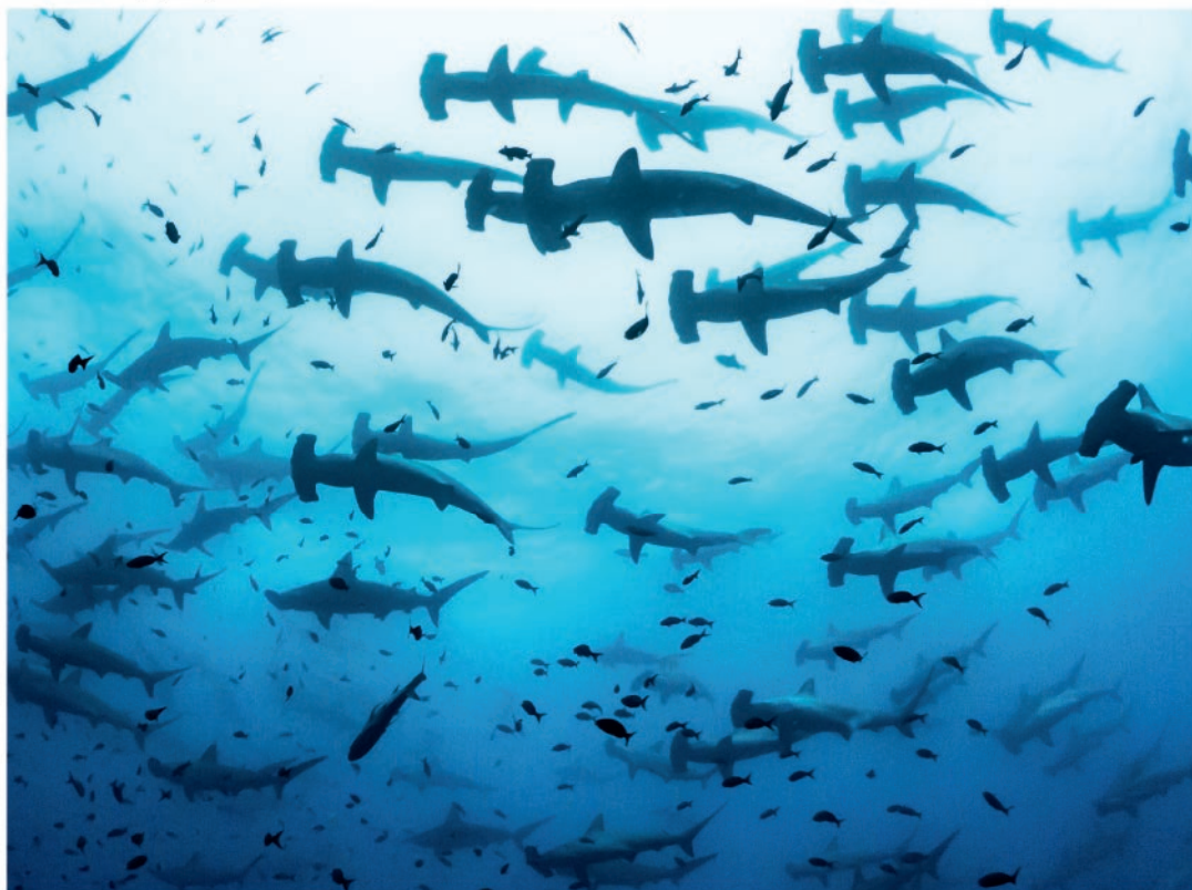
Kladivouni migrující k pobřeží kostarického Kokosového ostrova

I ti, co na koni nikdy neseděli, v skrytu duše touží uhánět na bujném oři po písčité pláži. Nebo ne? Pobřeží Kostariky je 1 288 km dlouhé: Chcete-li vidět východ slunce, vydejte se ke Karibskému moři, dáte-li přednost projíždce na koni při západu slunce, zamířte k pobřeží Tichého oceánu.