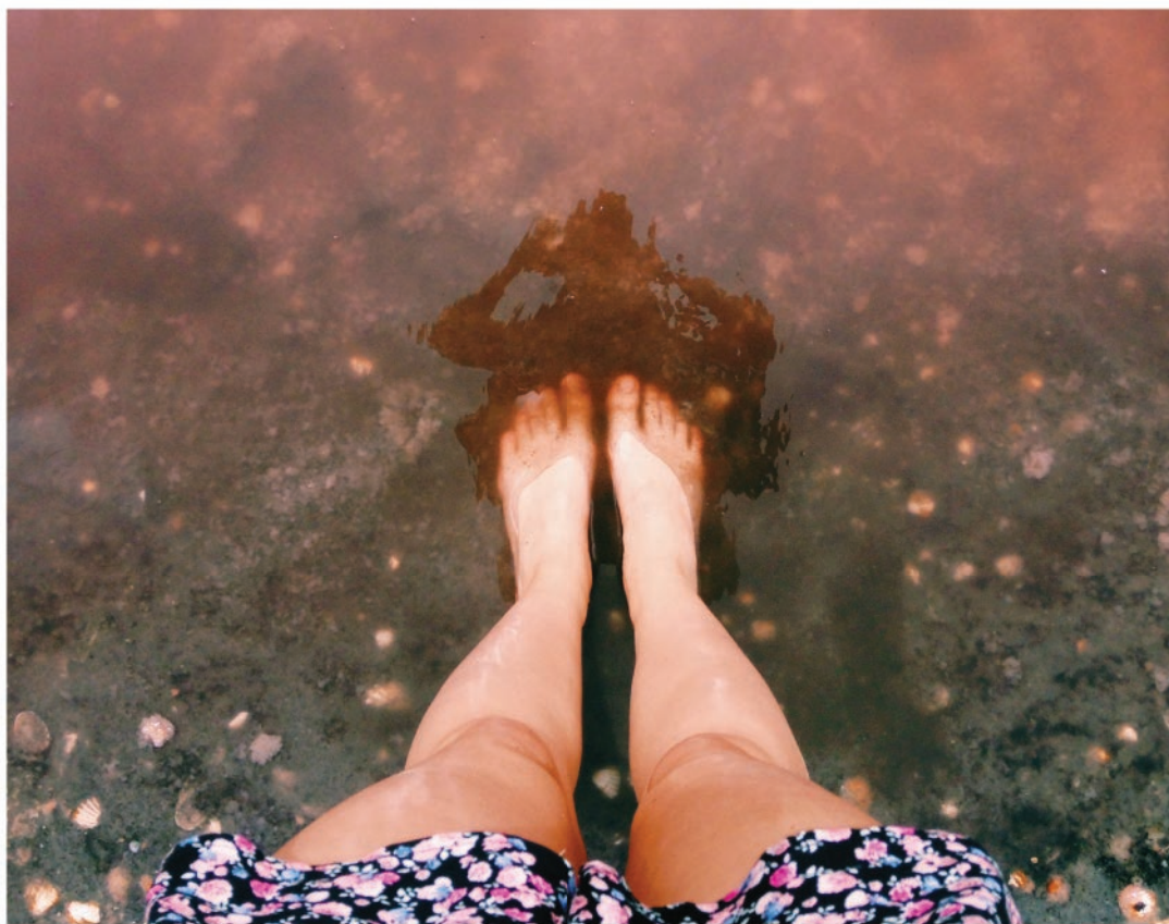
Jahodově zbarvené senegalské jezero Retba

Jezero Retba dělí od moře jen úzký pás písčiny, díky čemuž je voda v jezeře slaná. To vytváří dokonalé podmínky pro červené řasy, které se v něm hojně vyskytují a které způsobují jedinečné zbarvení vody. Vypravte se tam a v růžovém jezeře si smočte nohy.