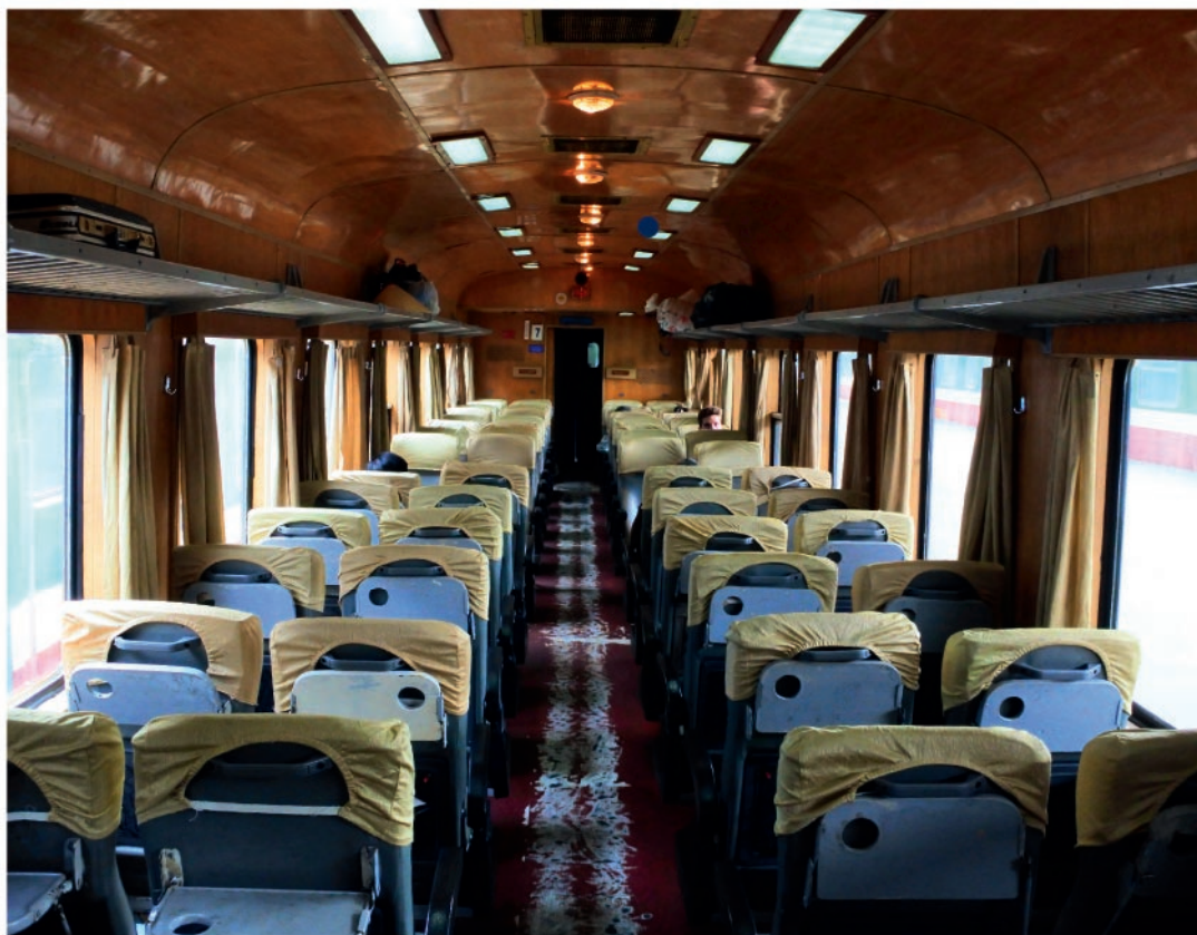
Reunification Express ve Vietnamu

Reunification Express nabízí nejúžasnější cestu vlakem, kterou jste kdy zažili. 1 726 km dlouhá železniční trať vede z Ho Či Mínova města (bývalého Saigonu) až do Hanoje a provede vás tím pravým Vietnamem. Železnice byla využívána Američany během vietnamské války. Po válce se vláda snažila zlepšit spojení mezi severním a jižním Vietnamem, a pustila se do rekonstrukce: Na trati bylo opraveno 1 334 mostů a 27 tunelů. Na první poválečnou jízdu vyrazil Reunification Express na Silvestra 1976.