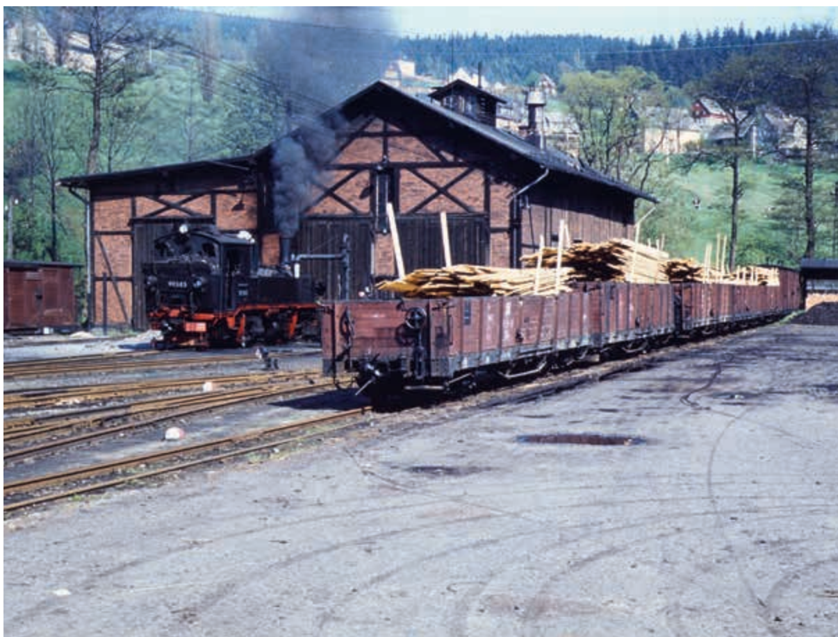
Atmosféra všedního dne v koncové stanici Rittersgrün. Snímek byl pořízen v dubnu roku 1970.

V roce 1977, tedy ještě v časech existence NDR, bylo na ploše někdejšího rittersgrünského nádraží a přilehlé výtopny zřízeno malé železniční muzeum, které existuje dodnes. Mezi jeho hlavní exponáty patří lokomotiva 99 579 někdejší saské řady IV K.