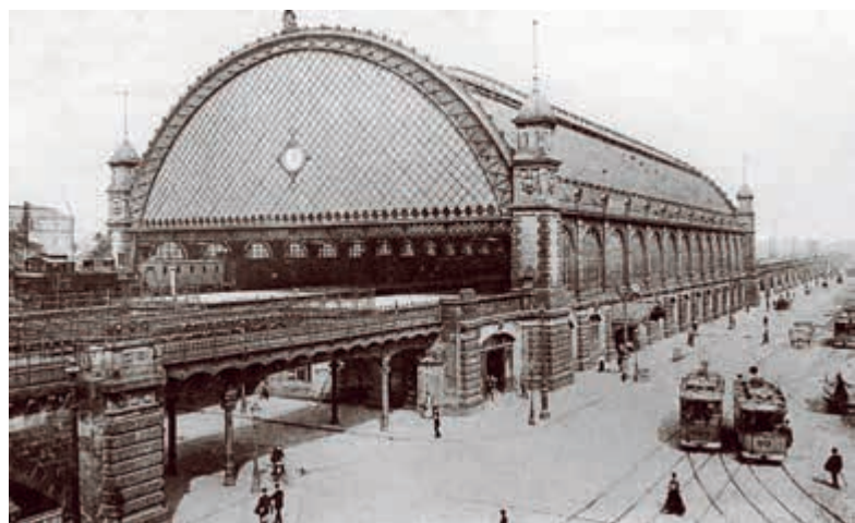
Takto vypadalo v roce 1908 wettinské nádraží v Drážďanech. Dnes se tato stanice jmenuje Dresden Mitte a má úplně jinou podobu, protože zobrazená původní secesní hala byla zcela zničena při spojeneckém náletu na město 13. února 1945.

Budování pak nabralo mnohem rychlejší tempo. Do roku 1915 bylo v Sasku postupně postaveno až 1027 km normálněrozchodných vedlejších tratí. Přestože se u těchto drah od prvopočátku počítalo jen s nízkou rentabilitou, ukázalo se velmi záhy, že v některých lokalitách by výstavba tratě