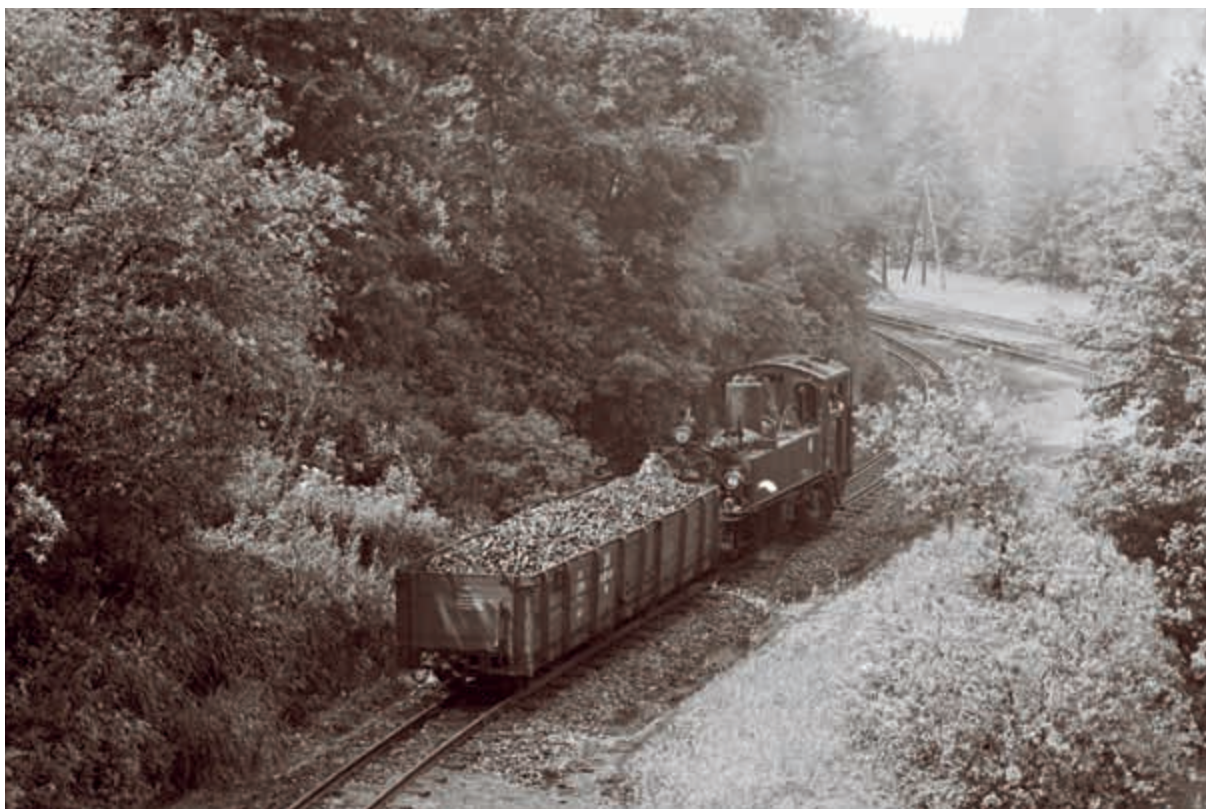
„Meyerka“ řady IV K v blízkosti Carlsfeldu v roce 1967.

Tato dráha byla nejen nejstarší, ale i nejdelší úzkokolejkou v Sasku. Její výstavbu požadovali především majitelé textilních továren v městě Kirchberg. Koncesi k jejímu vybudování vydal zemský sněm v Drážďanech až na třetí pokus v roce 1879. Trať vznikala postupně po etapách a po celkovém dokončení až do Carlsfeldu měla délku 42 km. Stavební práce na prvním úseku do Kirchbergu začaly 10. května 1881 a provoz tam pak byl zahájen 16. října 1881. Poslední úsek malodráhy byl zprovozněn 22. června roku 1897.