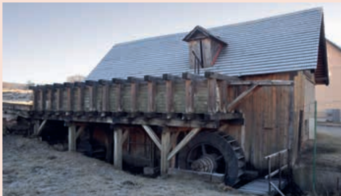
▲ Hámor Medzev

motyky, podkovy či lopaty, boli natoľko kvalitné, že ich bolo dobre poznať v celom Uhorsku. Ďera dielni pomínula a pre hámre sa dnes píše nová kapitola ich života. Veľa z nich zaniklo a tie funkčné, čo zostali, slúžia muzeálnym účelom. K príkladom dobre zachovalého hámru je Tischlerov hámor , ktoré spravuje Slovenské technické múzeum. V jeho dielni sa vás dotkne duch minulých časov a precítite atmosféru vidieckeho kováčskeho života.