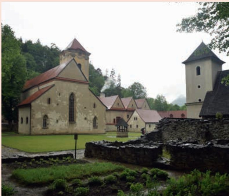
▲ Červený kláštor.

Vstupné: dospelí: 3 €; dôchodcovia: 2 €; študenti, invalidi a ZŤP: 1 €; poplatok za fotografovanie: 2 €