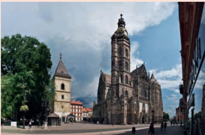
▲ Najznámejšou stavbou mesta Košice je Dóm sv. Alžbety.

Na mieste dnešného Dómu pôvodne stál jednolodňový kostol, ktorý však vyhorel po požiari v roku 1378. Táto skutočnosť bola impulzom pre vytvorenie honosného kostola zasvätenej svätej Alžbete Uhorskej. Práce na kostole trvali až