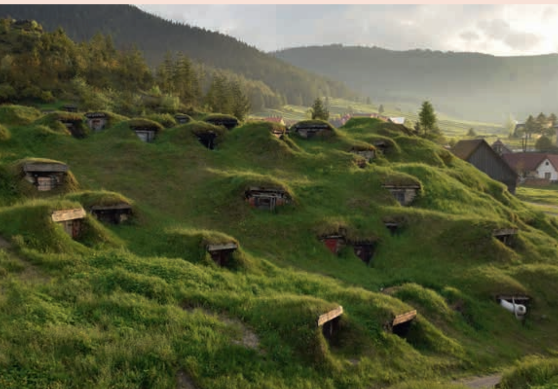
▲ Nápadité pivničky na zemiaky sa nepodobajú žiadnym iným pivničkám.