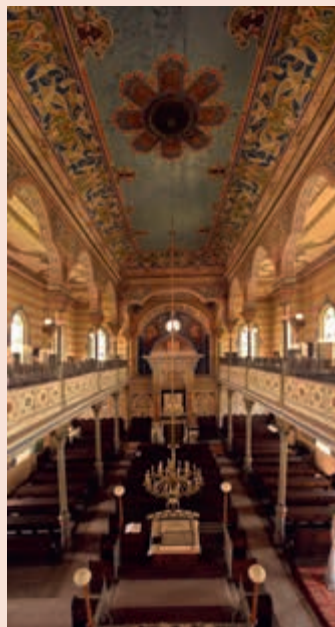
▲ Interiér nádhorne zdobenej synagógy v Prešove.

prvé synagógy v meste. Jednou z nich bola aj Ortodoxná synagóga z roku 1898 schovaná v bočnej uličke v historickom centre. V jej okolí vyrástol komplex sakrálnych, ako aj iných budov slúžiacich náboženskej obci. Okrem týchto budov vzniklo v Prešove v roku 1928 prvé židovské múzeum na našom území. Tento predchodca dnešného Múzea židovskej kultúry sa nenachádzal v synagóge ako dnešné múzeum, ale v budove mestského opevnenia Kumšt. Krušné časy nastali pre židovskú obec počas druhej svetovej vojny, kedy z Prešova a okolia bolo deportovaných cez 6 400 obyvateľov. Paradoxne muzeálna zbierka nebola rozkradnutá a prežila obdobie neslobody. Po druhej svetovej vojne z pôvodných 308 Židov prežilo a ostalo žiť v meste len 60. Do roku 1993 sa stali predmety múzea súčasťou múzea v Prahe. Po vzniku Slovenskej republiky zbierku začalo spravovať Múzeum židovskej kultúry, ktoré je súčasťou Slovenského národného múzea. Zo spomínaného impozantného interiéru synagógy vyzdobeného bohatými nástennými maľbami v orientálnom