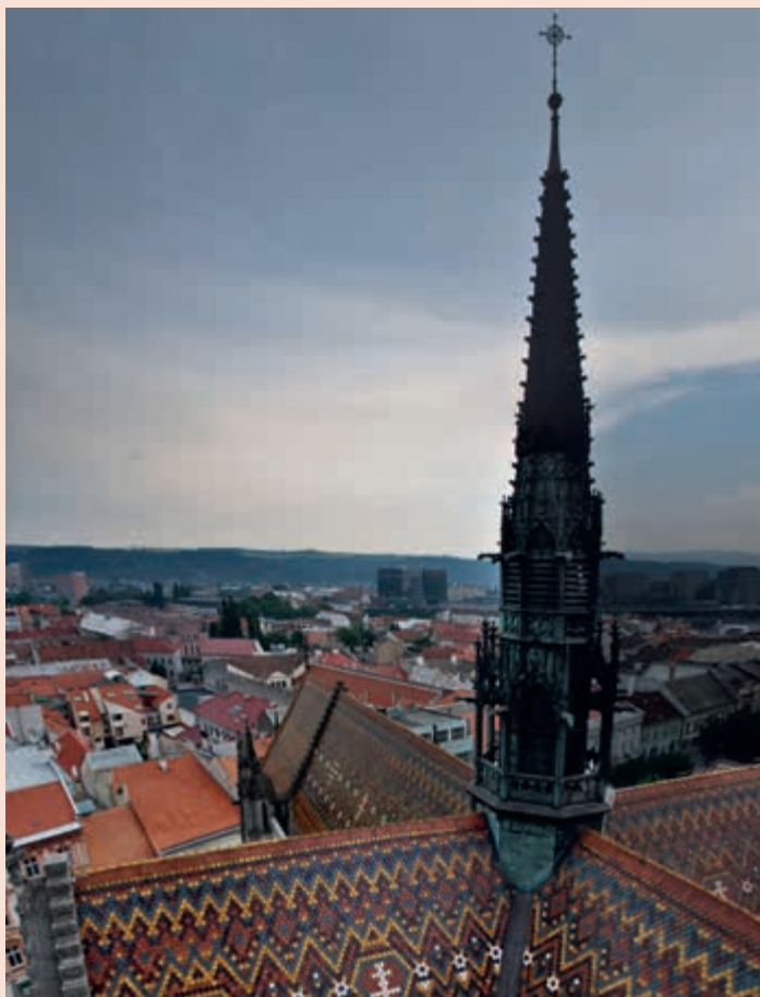
▲ Strechu chrámu zdobí ornamentová výzdoba.

do šestnásteho storočia, no aj tento kostol trápili požiare. Dnes je tento symbol Košíc najväčším kostolom na Slovensku a zároveň aj najvyšším gotickým chrámom v Európe. V jeho interiéri môžete obdivovať súbor 48 gotických tabuľových malieb. Naopak, v jeho exteriéri vás zaujme množstvo gotických detailov, medzi ktoré určite patria sochy strašidelných chrličov či panovníkov, tympanón zobrazujúci posledný súd ako aj krypta, v ktorej je pochovaný revolucionár František Rákoci II. Pre milovníkov vyhladok ponúka severná veža, nazývaná aj Žigmundova, po prekonaní 160 schodov výhľad na všetky strany z centra mesta.