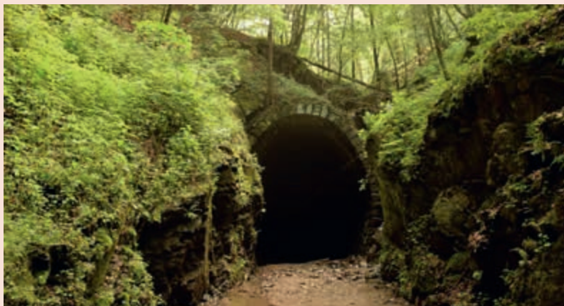
▲ Jeden z vchodov do tunela.

Okrem tunela navštívte v obci Slavošovce aj rodný dom ich najväčšieho rodáka, rozprávkara Pavla Dobšinského .