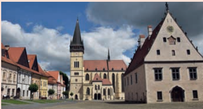
▲ Pohľad na Baziliku z námestia.

Medzi významné náboženské stavby patrí aj jedna z typických dominant Bardejova (str. 41). V severnej časti významného, historicky a kultúrne bohatého okresného mesta nájdeme kostol sv. Egidia. Počas storočí stredoveký chrám menil veľakrát svoju podobu, vďaka čomu môžeme na ňom pozorovať vývoj gotického staviteľstva.