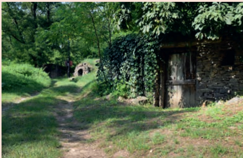
▲ Malebné vinne pivnice v Malom Horeši.

Jedna z najstarších dedín v oblasti Dolného Zemplína je Malý Horeš, no v tejto zväčša pohraničnej oblasti dedinku skôr poznajú pod jej maďarským názvom ako Kisgerés. Domy stáli v dedine už pred príchodom Tatarov v 13. storočí. Miestnym obyvateľom sa podarilo zaiste prežiť vďaka blízkemu tufovému návršiu, kde sa mohli schovať po vyhlbení jám. Dnes by ste našli na tomto mieste agátový háj a v ňom 82 malebných pivníc s vínom. Pred pivnicami často uvidíte posedenie alebo malé prístrešky. Niektoré pivnice sú bez