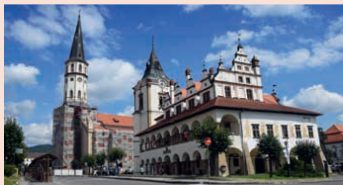
▲ Dve dominanty námestia v Levoči sú Bazilika sv. Jakuba a stará radnica.

Na odľahlom mieste v náručí prírody Národného parku Pieniny by ste asi ťažko čakali, že vás tu prekvapí nejaká zaujímavá stavba. Omyl je však pravdou. Práve takéto odľahlé miesta lákali v stredoveku mníchov, aby sa utiahli od hriechnej spoločnosti. Na brehu rieky Dunajec, pri slovensko-poľských hraniciach, s výhľadom na impozantné Tri koruny, skúste spomalit od bežného života. Za múrmi kláštora objavíte ideálne miesto, kde čas akoby zastal. Stačí sa len prejsť po chodbách kláštora, s ktorým sa spája aj jedna legenda a pocítite veľkú pokoru a pokoj.