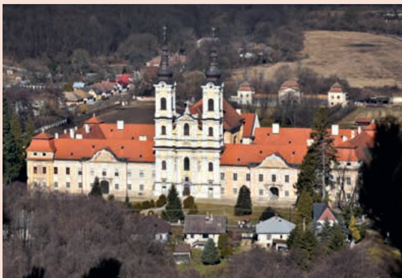
▲ Pohľad na kláštor Jasov z Jasovskej skaly.

dospelí: 5 €; deti, študenti a seniori: 2,50 €