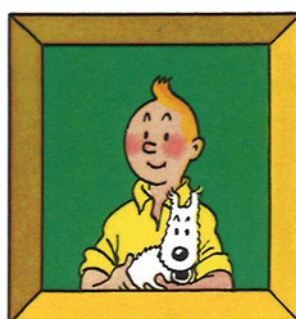
...mladý reportér Tintin, který bude zastupovat tisk,