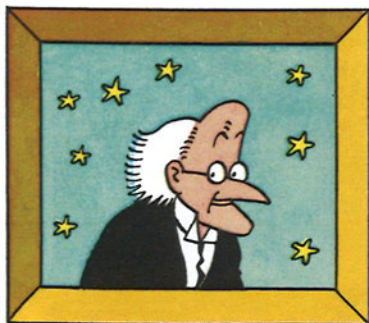
Výpravu vede profesor Kalys, který v daném aerolitu odhalil přítomnost neznámého kovu. Dalšími členy expedice jsou: