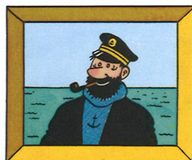
...a konečně kapitán Haddock, předseda LNA (Ligy námořníků abstinentů), který má velet lodi AURORA, na níž se bude výprava plavit.