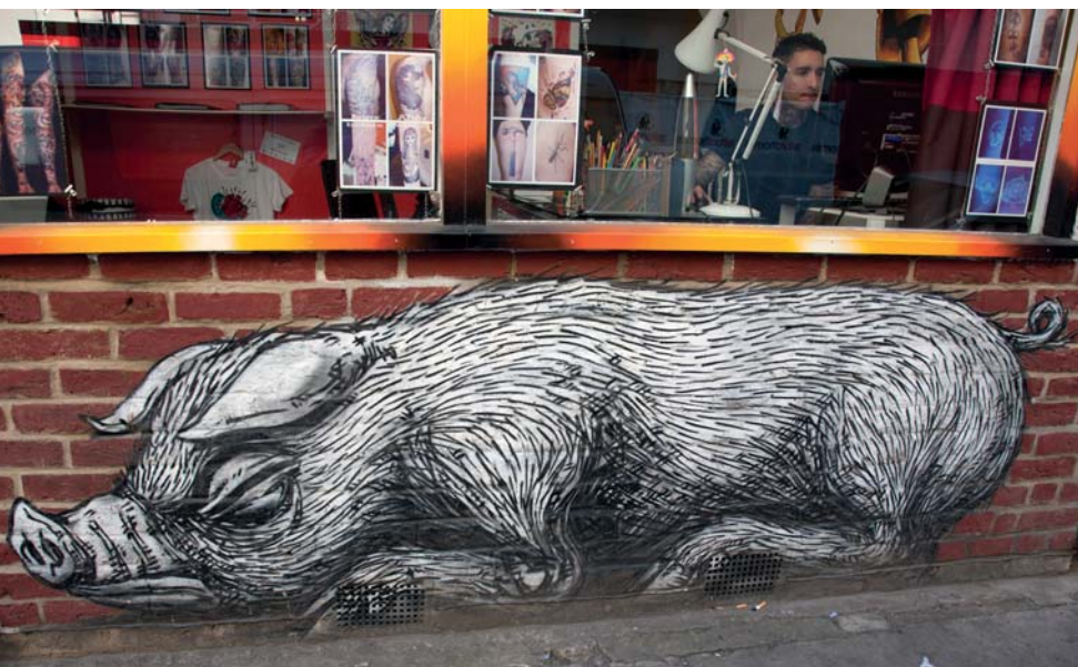
Londýn, Velká Británie