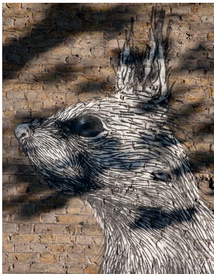
Londýn, Velká Británie

Jeho jednobarevná zvířata, která stojí na stráž, vznášejí se jako hrozba na stěnách parkovišť nebo dřímají podél chodníků, představují divokost bytí, od níž jsou obyvatelé měst zcela odtrženi. A možná také pobízejí k tomu, abychom si uvědomili, že tuto planetu sdílíme s mnoha dalšími živočišnými druhy.