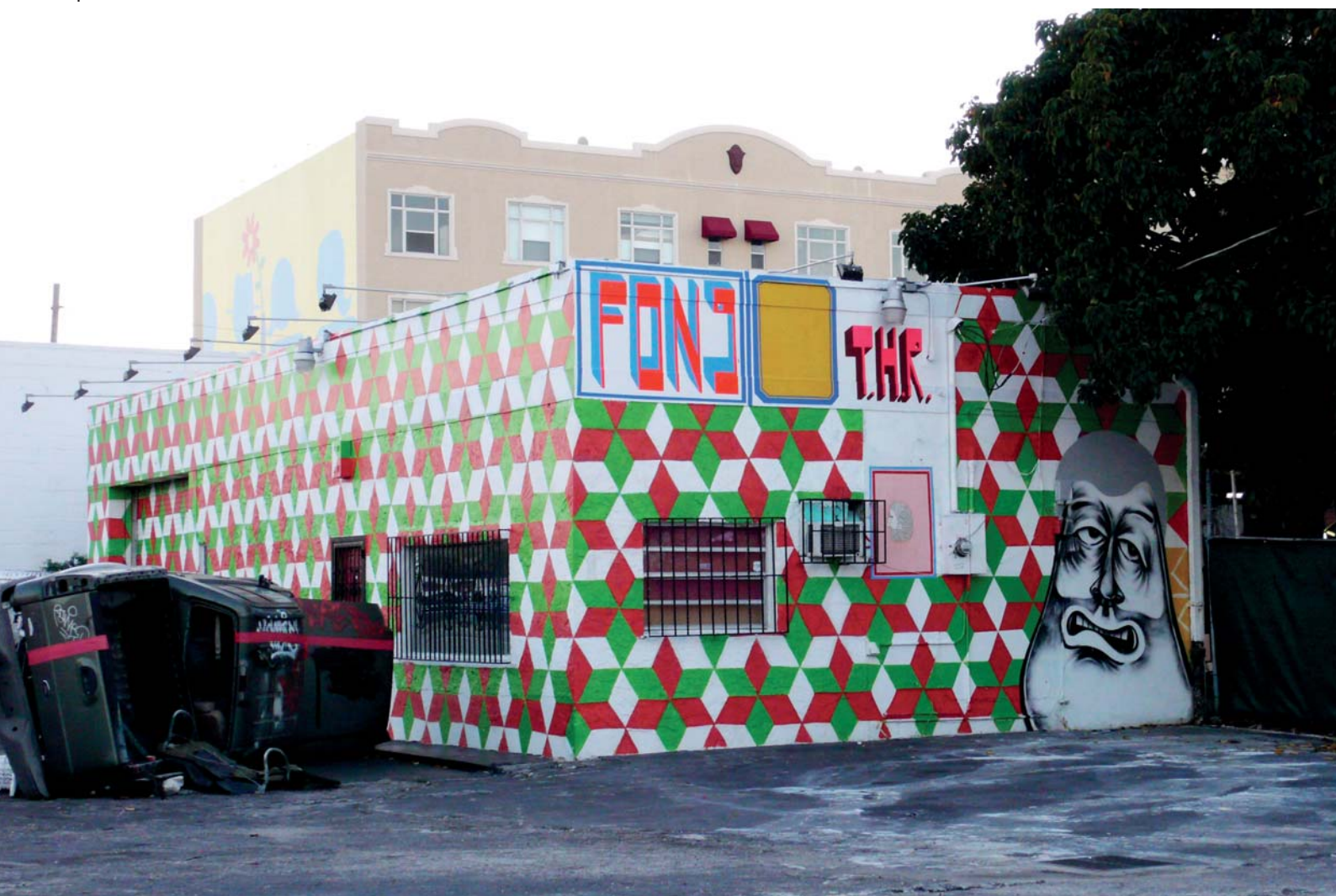
Všechna díla na této dvoustraně pocházejí z Miami, USA

Jako jeden z nejstarších a nejvýznamnějších představitelů urbánního umění se stal mentorem mnoha mladších umělců. Ačkoli se jeho díla objevují v mnoha významných galeriích po celém světě, tvrdí, že nejšťastnější je, když může pracovat na ulici.