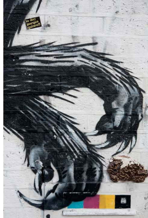
Londýn, Velká Británie