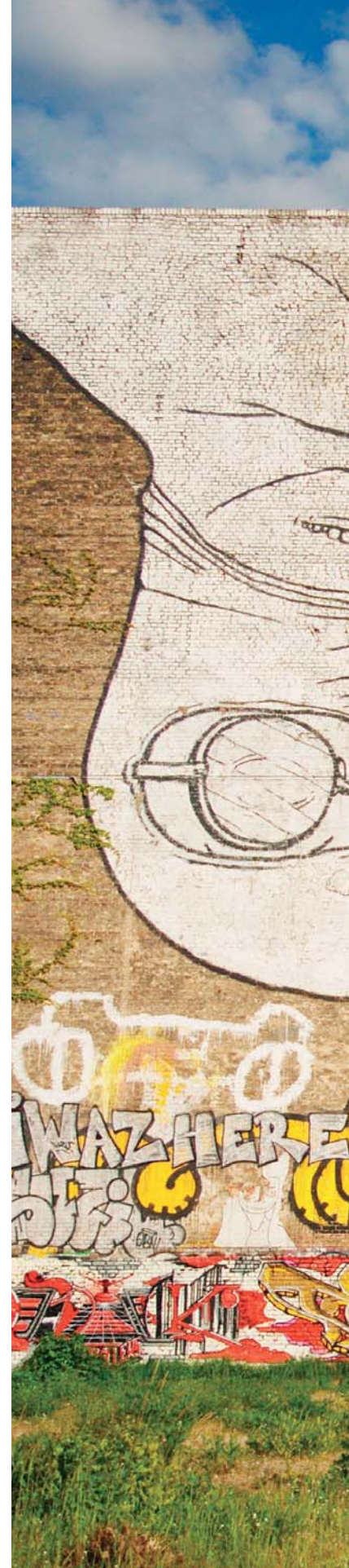
Obě díla pocházejí z Berlína, Německo