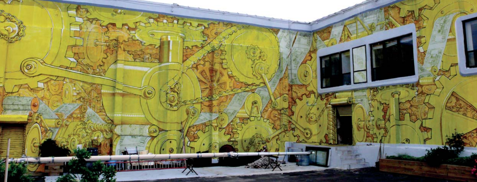
New York City, USA