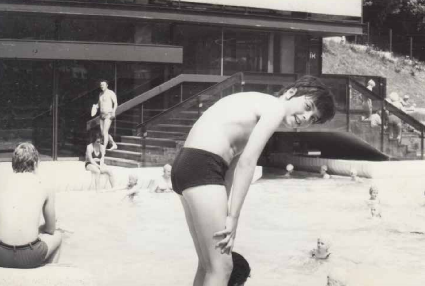
popisekk xxxxxxxx xxxx

mluvili o tom, co budeme dělat. Začalo nám docházet, že jestli se nic nezmění, budeme jednou muset sami učit ty hrůzy, které se teď biflujeme. Začalo nás to děsit.“ Po vystřízlivění však rozpolcenost pokračovala, protože všichni chtěli dokončit školu: „Fakt jsem nepřišel na nic lepšího, než že to nějak ošulím, že to snad nějak půjde. Asi tu situaci vystihuje, co říkal jeden můj kamarád v hospodě. My těm hajzlům ukážeme! Ale nejdřív dostudujeme – pak jim ukážeme! Většina lidí kolem mě to měla takhle: jednou jim ukážeme... Takhle se blábolilo.“