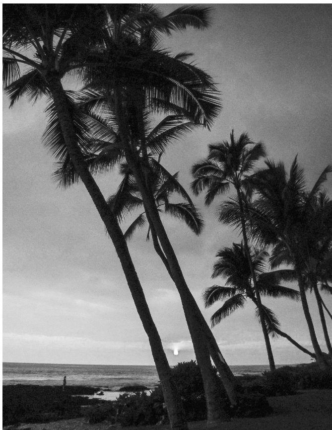
Hawaii (Big Island) – západ slunce před hotelem v Kona

Pozorovali jsme aktivní sopku, deštný prales plný exotických květin (a divokých prasat) a romantické západy slunce na pláži na havajském ostrově Big Island.