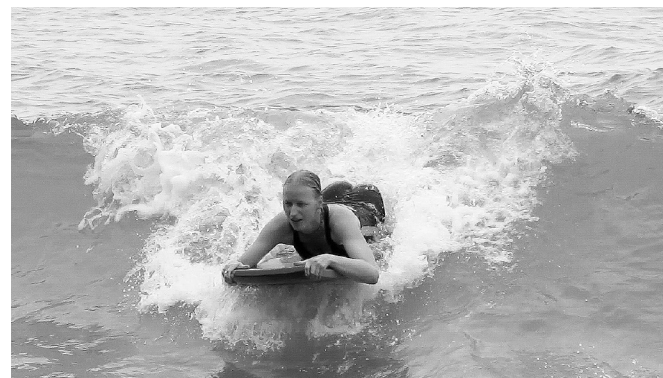
Hawaii (Big Island) – boogie boarding na Hookena Beach

Mojí oblíbenou zábavou na Havaji bylo sjíždět vlny, což bohužel skončilo zlomeným prstem na noze.