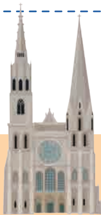
KATEDRÁLA NOTRE-DAME Jedna z najväčších a najkrajších gotických katedrál sveta stojí vo francúzskom meste Chartres.

Územie západnej Európy leží sčasti na pevnine a sčasti na ostrovoch. Najznámejšie ostrovy sa nazývajú Veľká Británia a Írsko. Na nich leží štát Spojené kráľovstvo Veľkej Británie a Severného Írska, do ktorého patria štyri krajiny – Anglicko, Škótsko, Wales a Severné Írsko. Ostrov Írsko zaberá Spojené kráľovstvo len v jeho severnej časti, vo zvyšku sa nachádza štát, ktorý má rovnaký názov ako ostrov, teda Írsko. Medzi ostrovmi a pevninskou časťou sa nachádza prieliv, pomenovaný kanál