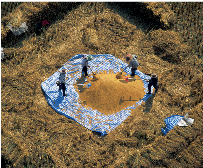
Severští farmáři čistí rýži. Thajsko je největším světovým vývozcem rýže

Západně od Chiang Mai stojí dříve odlehlá města Mae Hong Son a Pai, v nichž hlavní atrakci představuje turistika a rafting na řece. Severně od Chiang Mai se rozkládá