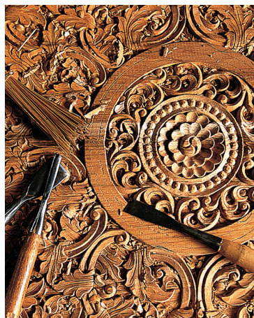
Detail dřevorezby, speciality v Chiang Mai