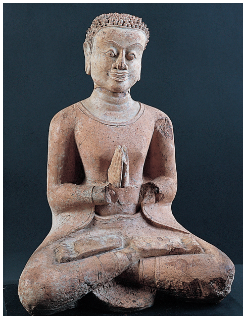
Tato terakotová socha je součástí pěkné sbírky v Národním muzeu v Chiang Mai

Muzeum bylo rozšířeno, aby v něm mohly být expozice týkající se přírodní a kulturní historie království Lanna, obchodu a hospodářství minulých staletí a moderního rozvoje bankovníctví, vzdělávání a veřejného zdravotnictví. Mezi tradičnější zde představovaná témata se řadí většina klasických uměleckých hnutí v Thajsku, od raných monských