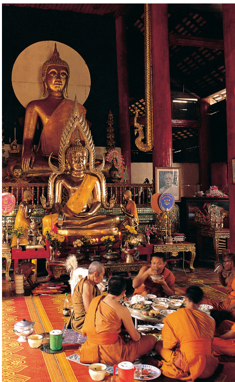
Mniši večeří v jednom z chiangmaiských hojně zdobených klášterů

muzeum: Toto malé muzeum u obrovského rušného tahu na okraji města je hlavním depozitářem umění a řemesel z Chiang Mai a severního Thajska. Betonovou budovu v lannském stylu otevřel v roce 1973 král s královnou a byla navržena nejen jako útočiště pro regionální (pokračování na str. 220)