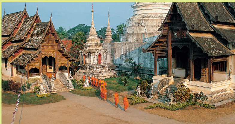
Wat Phra Sing, založený ve 14. st., byl náboženským centrem království Lanna

Tato procházka se vyhýbá oblastem s hustou dopravou a poskytne vám příležitost vychutnat si odlišné aspekty vnitřní části Chiang Mai, od poklidu kostela First Church k ruchu na tržišti Worowot; od šíleného tempa třídy Tha Phae k auře a míru v mnoha chrámech podél trasy.