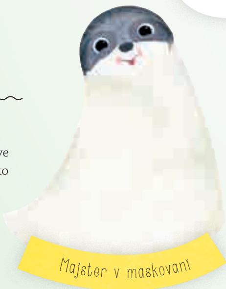
Majster v maskovaní

Vo voľnej prírode je ich srst pokrytá riasami , ktoré ju farbia do šedozelena. V záplave zelených listov tak funguje ako neviditeľný plášť! ▶