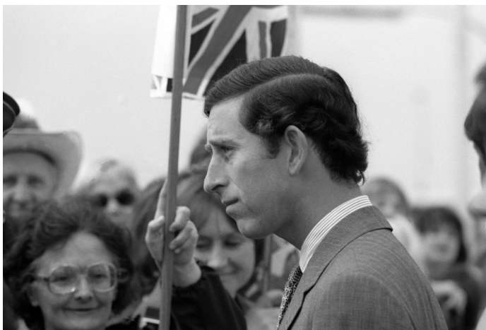
Princ Charles na letecké základně Andrews v USA, 1981

Během tří týdnů se přestěhovala do Buckinghamského paláce a začala se učit o životě na dvoře. Byl to konec soukromí. Před jejím prvním veřejným vystoupením na charitativní akci Charles zkritizoval Dianiny šaty. Byla otřesená a nervózní. Monacká princezna Grace jí řekla: „Neboj se, bude to mnohem horší!“