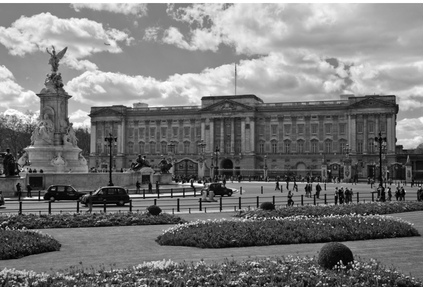
Buckingham Palace, Londýn