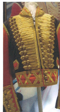
BUCKINGHAM PALACE / R. MEWS