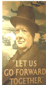
CHURCHILL WAR ROOMS