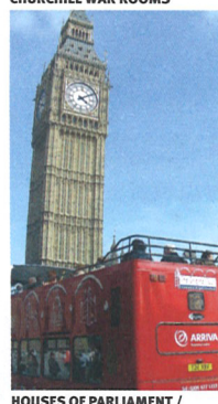
HOUSES OF PARLIAMENT / BIG BEN