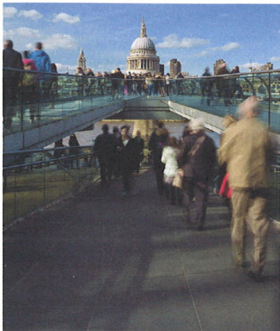
MILLENNIUM BRIDGE A SAINT PAUL CATHEDRAL