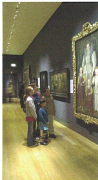
NATIONAL PORTRAIT GALLERY