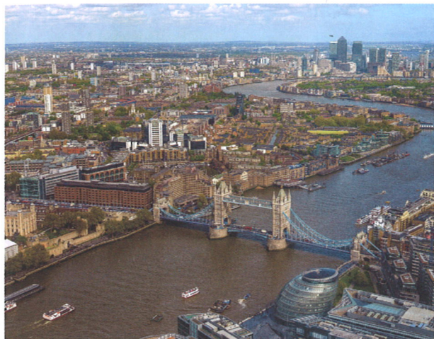
TEMŽE, TOWER BRIDGE A CANARY WHARF PŘI POHLEDU Z THE SHARD