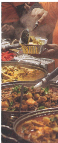
TRHY V EAST END