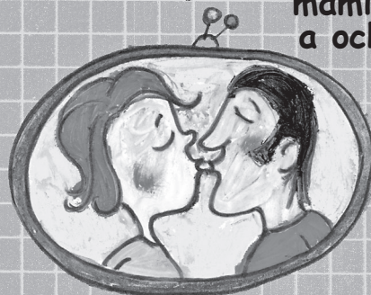
mamina a ocko