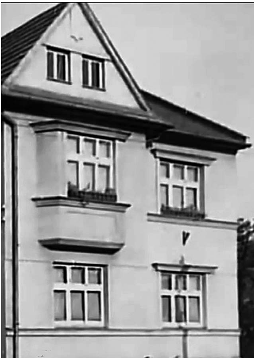
Dům v Uherském Hradišti v Šafaříkově ulici, kde malý Miki vyrůstal