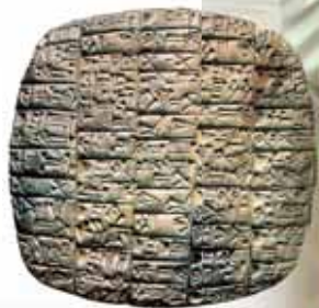
Popísaná hlinená tabuľka

Sumeri spočiatku používali na obchodné záznamy iba číslice a obrázky. Zapisovali ich vtlačaním tupého rydla do vlhkého ílu. Neskôr údaje o vojnových úspechoch a rozsiahlych stavebných dielach zaznamenávali na ilové tabuľky, ktoré potom vypaľovali.