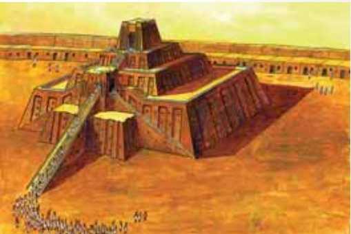
Zikkuraty, stupňovité chrámy, spájali nebesia so zemou.

Severný chrám v Eridu bol postavený na počesť boha múdrosť Enkiho okolo roku 4000 pred n. l. Tento zikkurat z hlinených tehál stál na umelo vytvorenom pahorku, aby bol bližšie k bohu. Steny chrámu mali výstupky, ktoré dodávali múrom väčšiu stabilitu, a hore viedli terasovité stupne. Na vrchole bola svätyňa, kde kňazi vykonávali obety.