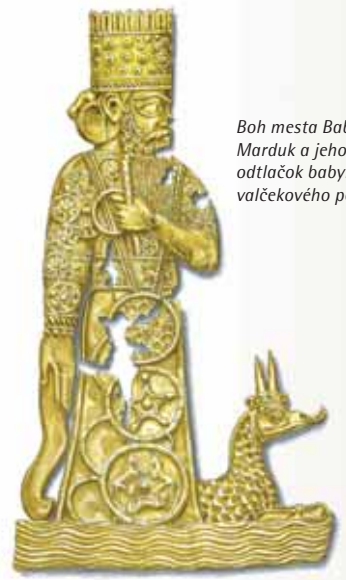
Boh mesta Babylon Marduk a jeho drak, odličok babylonského valčekového pečatidla

SUMERI Starovekí Sumeri boli nižšej postavy, mávali veľké oči a rovný nos. Muži nenesli fúzy a zvyčajne si holili hlavu. Obliekali si krátku tógu alebo široký šál, ktorý si viazali tak, aby mali pravú ruku voľnú. Najradšej pili pivo a obľubovali šperky, najmä preto, že drahým kameňom pripisovali liečivú moc. V sumerskom živote mali veľký význam hudba a tanec. Poznali už predchodcov dnešnej harfy, bubna, trombónu, gájd a lesného rohu. Obľube sa tešili koncerty organizované pre početné obecenstvo, často na rozkaz hlavy bohatej rodiny.