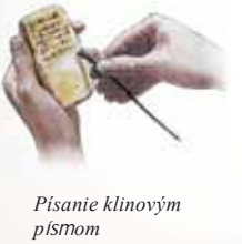
Písanie klinovým písmom