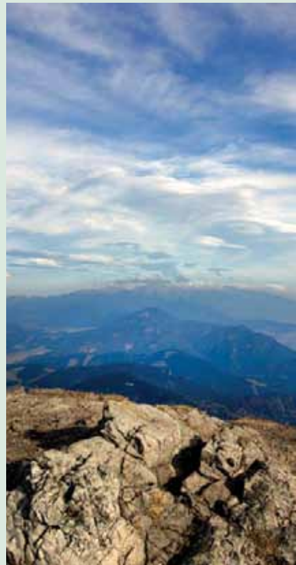
▲ Rozprávkový výhľad na Tatry z Veľkého Choča.

Veľký Choč je najvyšším vrchom pohoria Chočské vrchy , ktoré susedí s Veľkou a Malou Fatrou na západe a so Západnými Tatrami na východe. Vede k nemu viacero turistických trás, pričom na každej natrafíte na nejakú zaujímavosť. Môžete napríklad vyraziť z obce Lúčky (str. 83), ktorá patrí medzi najstaršie kúpeľné lokality na Slovensku. Ak máte radi pokojnú atmosféru kúpeľných komplexov, pred zahájením výstupu po červenej značke sa tu môžete rozhliaďnúť a načerpať sily pred