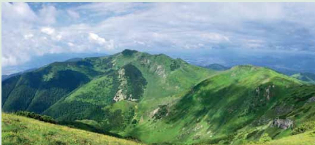
▲ Panoramatický pohľad z vrcholu Veľkého Kriváňa.

Vraví sa, že koľko ľudí, toľko chutí. V prípade Veľkého Kriváňa však všetkých návštevníkov spája spoločný cieľ – dosiahnutie vytúženého vrcholu. Každý si môže zvoliť ideálnu trasu, ktorá mu bude najviac vyhovuje, a že si Veľký Kriváň naozaj zaslúži vašu pozornosť, o tom niet pochýb. Stačí sa prísť presvedčiť.