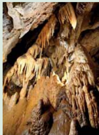
▲ Bystrianska jaskyňa

Veľký okruh: dospelí: 15 €; študenti, dôchodcovia: 13 €; deti od 6 – 15 rokov, ZŤP: 7,50 €