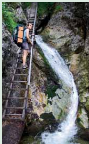
▲ Oceľovým rebríkom cez Jánošíkove diery.

Túru je najlepšie začať pri hoteli Diery za Terchovou, na mieste zvanom Biely Potok. Dá sa tu zaparkovať na veľkom platenom parkovisku. Modrá značka vás približne po pol hodine dovedie k Dolným dieram, kde si môžete vybrať, či budete ďalej pokračovať po modrej značke alebo či si zvolíte obchádzkový variant po žltej značke cez tzv. Nové diery. Touto obchádzkou vedie aj náučný chodník, ktorý sa neskôr opäť napojí na modrú značku. Tá plynule prejde do tretej časti dier – do Horných dier. Keď prekonáte všetky prekážky, postupne sa dostanete nad hranicu lesa a privíta vás výhľad na Malý Rozsutec. Hoci je nižší ako jeho väčší brat Veľký Rozsutec (str. 50), náročnosťou výstupu ho na mnohých miestach predbehne. V sedle Medziholie odbočte dolava na červenú značku