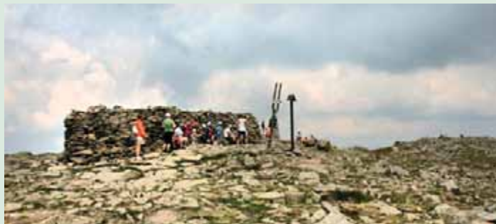
▲ Vrchol Babej hory s kamenným múrikom proti vetru.

priam núka na oddychové vychutnávanie okolitej nádhery. Až na Malej Babej hore odbočte na červenú značku, ktorá vás privedie späť k chate Slaná voda, čím uzavriete celodenný okruh.