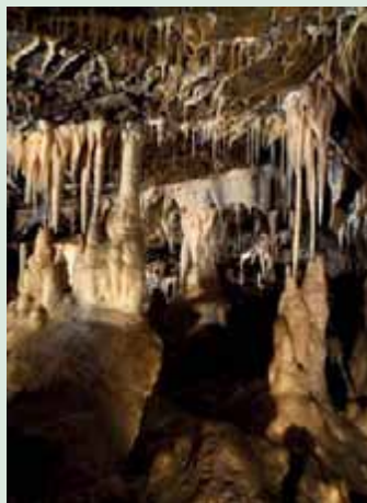
▲ Važecká jaskyňa.