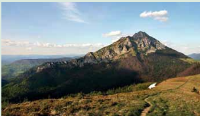
▲ Nezameniteľný tvar Veľkého Rozsutca.

Veľký Rozsutec vytvára neprehliadnuteľný bod na turistickej mape Slovenska. Patrí k tým vrcholom, ktoré vo vás, vďaka dobrodružnému výstupu a priam magickému kúzlu na vrchole, zanechajú veľké zážitky. A práve takéto zážitky neskôr tvoria nevyčerpatelný zdroj inšpirácie, šťastia a veselých spomienok.