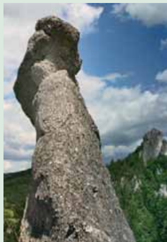
▲ Sochárske dielo prírody uprostred Súľovských skál.

Turistickým centrom Súľovských skál je obec Súľov, odkiaľ sa rozbiehajú všetky značené chodníky. Aby ste si čo najlepšie a z bezprostrednej blízkosti vychutnali skalný svet, vydajte sa po zelenej značke, ktorou súčasne vedie aj náučný chodník. Budete prechádzať okolo Súľovského hradu , z ktorého však zostali už len nepatrné pozostatky. Je len ťažko uveriteľné, že v minulosti na