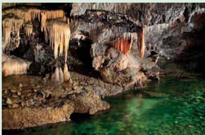
▲ Demänovská jaskyňa slobody.