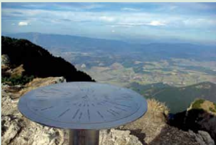
▲ Orientačný smerovník na vrchole Veľkého Choča.

trojhodinovou cestou na vrchol. Najväčším šperkom v Lúčkach je bezpochyby vodopád, ktorý sa nachádza priamo v obci. Rovnako dlhý výstup vás čaká aj z obce Jasenová , z ktorej na Veľký Choč tiež vedie červená značka. V Jasenovej sa nachádza pamätná izba jedného z najvýznamnejších predstaviteľov slovenského literárneho realizmu – Martina Kukučína . Najkratší, ale zároveň aj najstrmší variant výstupu vedie z obce Valaská Dubová, ktorý trvá približne dve a pol hodiny. Podľa legendy bol práve tu dolapený najslávnejší slovenský zbojník Juraj Jánošík. Najdlhší variant začína v obci Likavka pri Ružomberku. Treba pri ňom počítať s výstupom, ktorý bude trvať minimálne štyri a pol hodiny. Na tejto trase sa nachádza pôsobivá zrúcanina Likavského hradu (str. 12). Nech už sa rozhodnete pre ktorúkoľvek trasu, pri každej z nich počítajte s náročnou celodennou túrou. Vynaložená námaha sa však určite oplatí, pretože v peknom počasí dovidíte na Babiú horu (str. 52), Roháčce (str. 67), Nízke Tatry (str. 55, 57) aj na Veľkú a Malú Fatru (str. 49, 64). Pre zjednodušenie orientácie je na vrchole umiestnený kruhový smerovník s názvami všetkých okolitých vrchov. Nechýba ani vrcholová kniha, v ktorej sa môžete podeliť s ostatnými so zážitkami z vášho výstupu. A o tie určite nebude núdza, pretože Veľký Choč má pripravené prekvapenia skutočne pre každého.