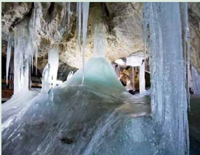
▲ Výzdoba v Demänovskej ľadovej jaskyni.

dospelí: 5 €; študenti, dôchodcovia: 4 €; deti od 6 – 15 rokov, ZŤP: 2,50 €