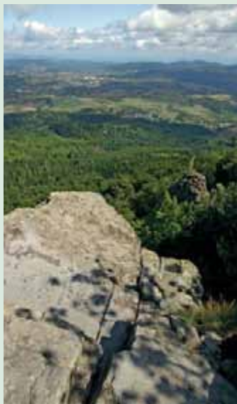
▲ Nádherný výhľad na Banskú Štiavnicu z plošiny tesne pod vrcholom Sitna.

Možnosť na výstup na Sitno je okrem spomínanej trasy viac. Od Počúvadla je však najkratšia, a tak ju bez problémov zvládnu aj menšie deti. Výlet je ideálne spojiť aj s prehliadkou ruín Sitnianskeho hradu , ku ktorým sa dostanete približne o 15 minút, keď budete od vrcholu pokračovať ďalej po modrej značke.