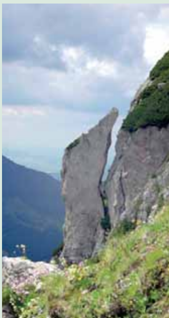
▲ Skalný zub na svahu Veľkého Rozsutca.