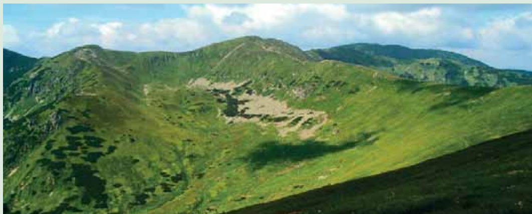
▲ Pôsobilý hrebeň Nízkych Tatier.

Pokiaľ patríte k aspoň čiastočne skúseným turistom, určite pouvažujte nad možnosťou spojenia návštevy Chopka s Ďumbierom. Ved' kto by odolal výzve vystúpiť na najvyšší vrch pohoria, keď už ste sa dostali tak blízko? Ak vám počasie aj čas bude priat, čaká na vás okúzľujúca cesta hrebeňom, ktorá je akosi odmenou za predchádzajúce náročné stúpanie. Výhľady do okolitých dolín sú priam rozprávkové a cestou nebudete vedieť, kde sa skôr pozerať a čo skôr fotiť. Na samý vrchol Ďumbiera sú to z Chopku približne dve a pol hodiny čistého času chôdze. V 2 043-metrovej nadmorskej výške vás privíta vysoký dvojkríž, kde opäť pocítite ten vzrušujúci pocit horského vrcholového šťastia.