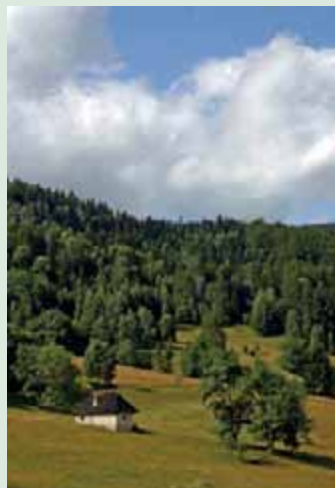
▲ Idylický pohľad na krajinu Muránskej planiny zo zelenej turistickej značky vedúcej z Tisovca.

Turistických chodníkov je na území Muránskej planiny dostatok, no prekonávajú pomerne veľké vzdialenosti a vždy je treba počítať s celodennou turistikou. Výnimku tvorí výlet na Muránsky hrad (str. 11), na ktorý vám z obce Muráň stačí hodina a pol. K ďalším obľúbeným miestam patrí najvyšší vrch Muránskej planiny – Fabova hoľa , ktorý je vysoký 1 439 metrov. Dostanete sa naň po červeno značenej Rudnej magistrále zo sedla Zbojská. Naspäť môžete ísť po žltej značke, ale na tejto trase ráťajte s menej hustým značením. Ak si chcete vychutnať charakter