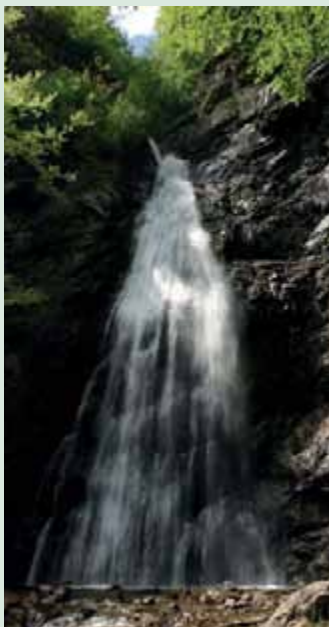
▲ Šútovský vodopád v plnej kráse s dostatkom vody.

Ak by vám predsa ešte zostávali sily aj čas, približne po tri štvrté hodine sa po modrej značke dostanete k zaujímavému prírodnému úkazu – k Mojžišovým prameňom . Je tu niekoľko prameňov, ktoré vytekajú zo skalnej steny a potom sa postupne spájajú do malého potôčika. Neskôr sa aj tento potôčik vlieva do Šútovského potoka a vodopádu. Modrá značka končí až pri Chate pod Chlebom , z ktorej sa môžete vydať až na Veľký Kriváň (str. 49). Toto je už však trasa na celodenný náročný túr.