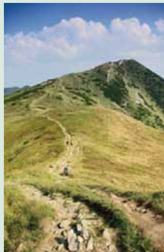
▲ Pohľad na Veľký Kriváň z vrchu Pekelník.

necelých 200 výškových metrov, takže približne o tri štvrté hodiny sa po červenej značke dostanete na vrchol. Cestu späť si zvolte rovnakú. Buď sa nechajte opäť zviezť lanovkou, alebo môžete ísť peši popod ňu. Náročnejšia alternatíva sa ponúka práve pri spiatočnej ceste. K chate Vrátna sa dostanete aj okruhom po nádhernom hrebeni, ktorý ponúka návštevu ďalších vrchov – Chleb a Poludňový grúň. Z Poludňového grúňa vedie k chate Vrátna žltá značka. Tento okruh by predĺžil výlet približne o tri a pol hodiny chôdze, takže by už patril do kategórie celodenných túr. Pochod hrebeňom, s výhľadom na celé pohorie, je obrovskou lahôdkou pre oči a zároveň ani nie je veľmi náročný. Odolnosť kolien by ste preverili iba pri prudkom zostupe z Poludňového grúňa. Väčšie deti by s ním nemali mať problém. K náročným variantom, pre skúsených turistov s kondičkou, patria výstupy z Terchovej (str. 143) cez Tiesňavy a vrch Kraviarske po modrej a žltej značke, z obce Šútovo okolo Šútovského vodopádu (str. 50) po zelenej trase. Nedá sa nespomenúť populárnu celú hrebeňovku pohoria od