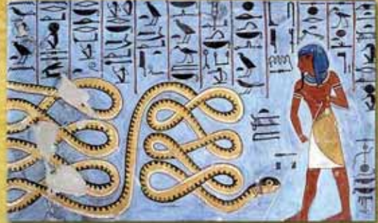
Staroveká egyptská malba znázorňujúca boha, ktorý zaháňa Apopa

Jednou z kľúčových postáv aztéckej mytológie, náboženstva aj umenia bol celé tisícročia operený had Quetzalcoatl. Často je zobrazovaný s ozdobnou čelenkou z peria kvesala. Bol bohom vetra, patrónom kňazov a tiež sa verilo, že stvoril svet.