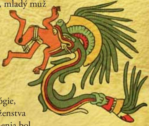
Kresba Quetzalcoatla požierajúceho muža z Kódexu Telleriano-remensis