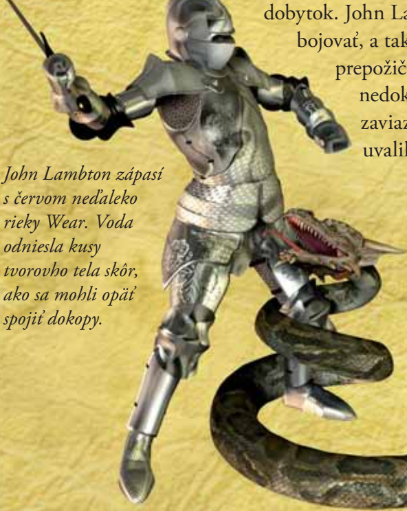
John Lambton zápasí s červom neďaleko rieky Wear. Voda odniesla kusy tvorového tela skôr, ako sa mohli opäť spojiť dokopy.

V severoeurópskej mytológii sa drak zvyčajne označuje slovom worm , čo znamená had alebo plaz . V starej angličtine sa stretne s označením wyrm . Stredoveké legendy opisujú červy ako obrovské plazy, ktoré nemajú krídla ani končatiny, zato majú dračie hlavy. Jedným z najznámejších príbehov o týchto tvoroch je legenda o wearskom červovi. Rozpráva príbeh o mladom Johnovi Lambtonovi, ktorý pri rybárčení chytil v miestnej rieke malého červíka a potom ho zahodil do neďalekej studne. Tvor však rokmi vyrástol do obrích rozmerov a začal napádať dedičanov aj dobytok. John Lambton sa rozhodol proti nemu bojovať, a tak uzavrel zmluvu s istou bosorkou, ktorá mu prepožičala moc, vďaka ktorej červa zabil. Žiaľ, mladý muž nedokázal splniť to, k čomu sa v zmluve zaviazal, preto čarodějka na jeho rodinu uvalila kliatbu.