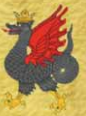
Zilant, druh wyverny, je dodnes oficiálnym symbolom ruskej Kazane.

na cintoríny, aby tam hodovali na telách zosnulých.