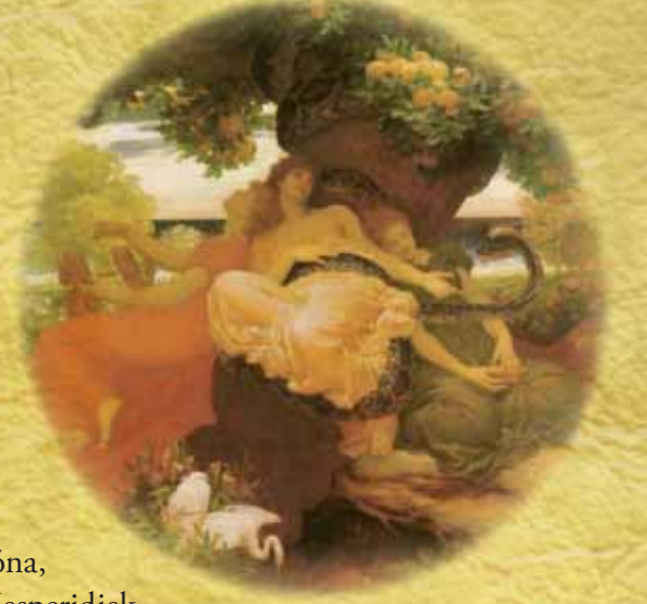
Záhrada Hesperidiiek od maliara Frederica Leightona

Jednou z ďalších Heraklových úloh bolo zabiť stohlavého hada Ladóna, ktorý strážil záhradu Hesperidiiek, aby odtiaľ mohol vziať jablká nesmrteľnosti.