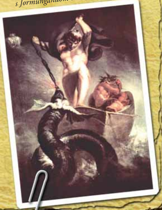
Malba znázorňujúca Thora bojujúceho s Jormungandom od Henryho Fuseliho

Hymir ho vystríhal, že sa plavia veľmi ďaleko na more a je to nebezpečné, no Thor na jeho slová nedal a začal loviť. Ako návnadu použil byvoliu hlavu, na ktorú sa Jormungand hneď vrhol. Po dlhom boji Thor konečne hada vytiahol na hladinu a chystal sa ho zabiť, lenže vydesený Hymir prerezal lano na udici a Jormungand unikol. S Thorom sa však opäť stretol počas Ragnaröku, poslednej bitky bohov. Vtedy Thor hada zabil, no vzápätí skončil aj on, otrávený jedom, ktorý naňho Jormungand vychrlil.