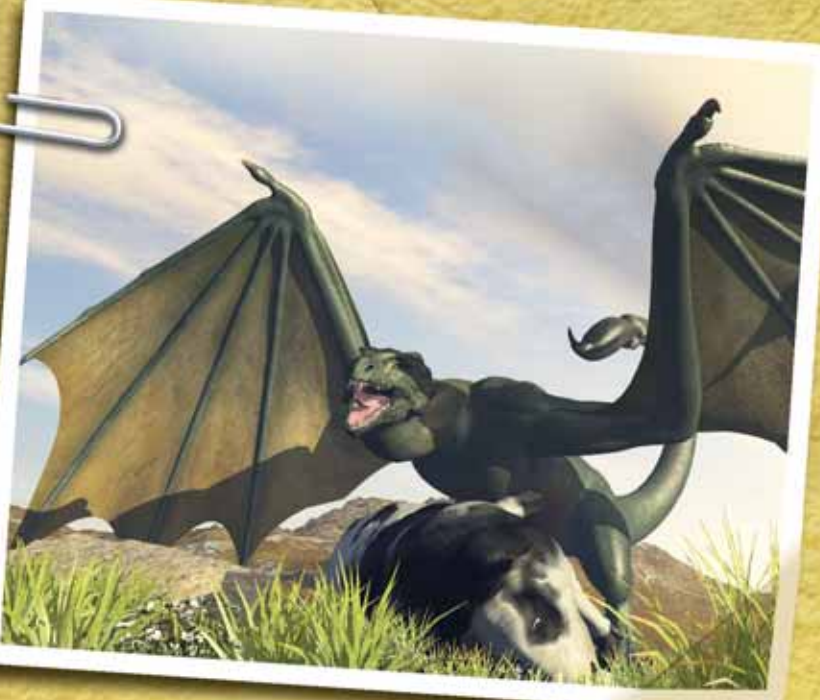
Podľa povestí by wyverny mali byť agresívnejšie než draky a napádať nielen dobytkom, ale aj ľudí.