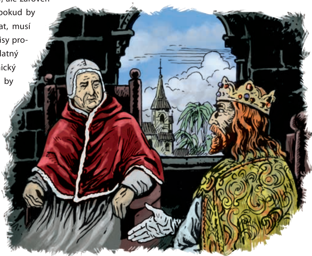
Zikmund Lucemburský na svém jednání se vzdoropapežem Benediktem XIII. nepochodil.

Splnit první podmínku nebyl žádný problém. Pisánský koncil byl stejně ze zpětného pohledu pořádné fiasko, které jen prohloubilo schizma. U druhé podmínky to bylo horší. Zikmund za ní tušil zradu. Koncil se přeruší a Benedikt jako jediný papež bude mít v rukou moc svolat koncil nový. Anebo ho také nesvolat a setrvat ve svém úřadu. Co by nastalo v takovém případě, se nedalo předvídat. To král nemohl připustit. Kostnický koncil musel být tím, který rozkol v církvi ukončí. Papežovy podmínky tedy přijaty být nemohly. Přesto Zikmund trval na papežově rezignaci a upozornil ho na fakt, že koncil ho zrovna tak jako jeho dva předchozí rivaly stejně nepokládá za právoplatného papeže. Pokud tedy on sám nerezignuje, bude stejně koncilem odvolán.