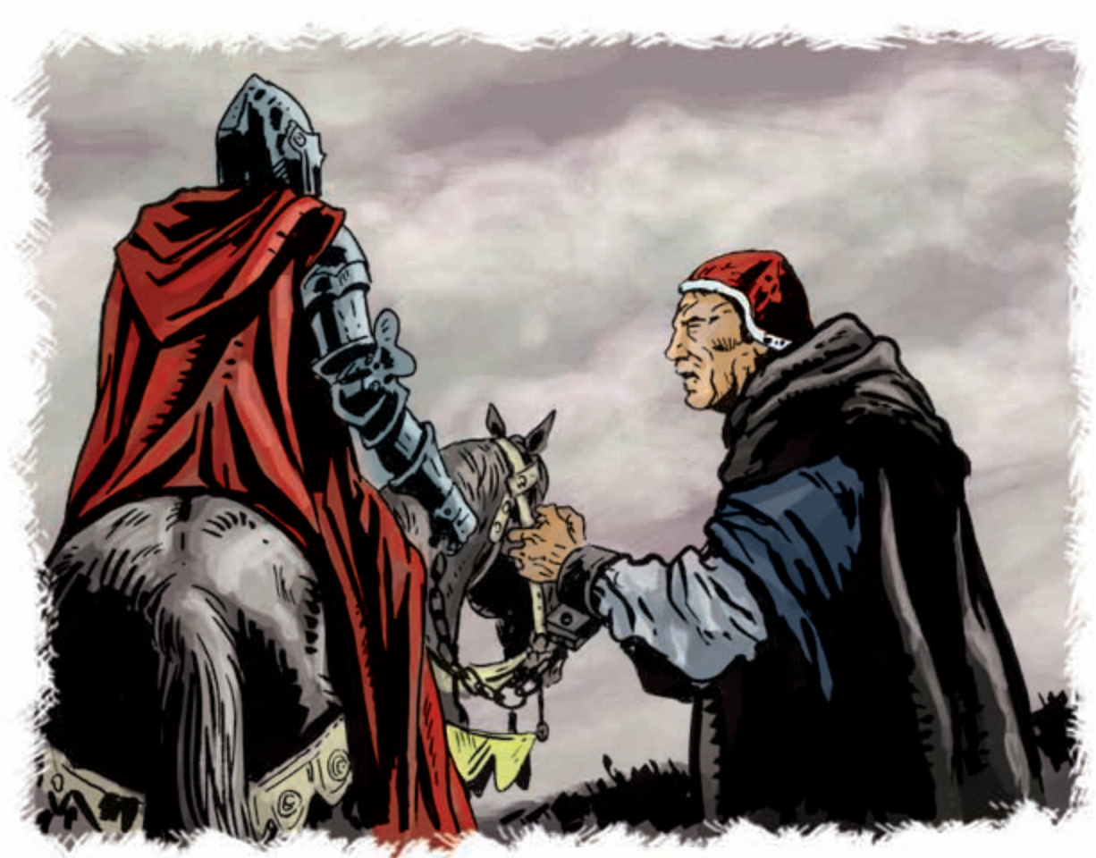
Jan XXIII. se snažil z kostnického koncilu uprchnout, ale byl dopaden a uvězněn.

Pro biskupy a kardinály šlo v podstatě o formalitu. Koncil rozpouštět nemuseli a k žádnému dalšímu výraznému zdržení nedošlo. Řehořův legát kardinál Beato Giovanni Dominici 4. července 1415 jménem papeže koncil znovu oficiálně zahájil a ještě při tomtéž zasedání biskupům oznámil, že Řehoř XII. se vzdává svého papežského úřadu. Řehoř z toho tedy vyšel se ctí a koncil ho zpátky jmenoval kardinálem. Bylo mu 88 let a měl před sebou ještě dva roky celkem pokojného života. I tato spolupráce s koncilem mu pomohla k tomu, že z historického hlediska je právě on uznáván jako skutečný papež, zatímco Jan XXIII. a Benedikt XIII. jsou vnímáni jako vzdoropapežové. Všimněte si ještě detailu, že koncil byl znovu zahájen dva dny před upálením mistra Jana Husa. Tehdy měl