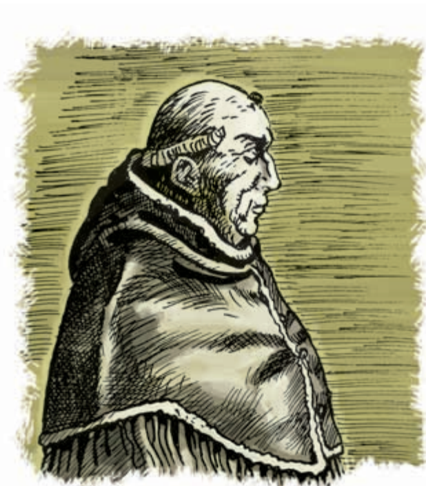
V Kostnici byl roku 1417 zvolen nový papež Martin V.

pravidelně, nejprve po pěti letech, pak po sedmi a poté vždy v desetileté periodě. Podmínkou kompromisu byly také speciální podmínky, za kterých bude nový papež zvolen. Tak se stalo, že v konkláve, které se sešlo 8. listopadu 1417, nezasedlo jen dvacet tři přítomných kardinálů, ale také třicet koncilních delegátů vybraných ze všech rokujících národů. Po třech dnech byl zvolen kardinál Oddone Colonna, který přijal jméno Martin V. K jeho volbě údajně přispěl zpěv chlapeckého sboru procházejícího kolem kupeckého domu v Kostnici, kde se konkláve konalo. Chlapci zpívali tak krásně, že rokující dojali až k slzám a zaplaveni emocemi se k volbě Colony připojili i jeho původní odpůrci. Neskrývané štěstí, jaké zaplavilo Kostnici a které se odtud rychle šířilo do okolních států, Evropa dlouho nepamatovala. Očití svědci popisovali desetitisícové davy táhnoucí městem a slavící duchovní obnovu jednoty církve.