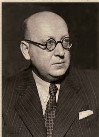
Český primátor Prahy v letech 1939 a 1940 Otakar Klapka. Spolupracovník předsedy vlády Eliáše a domácího odboje. V roce 1941 byl zatčen a během Heydrichova úřadování, krátce po vyhlášení stanného práva, popraven.

slov přicházel do českých zemí jako „nepřítel všech nepřátel a ochránce všeho německého“. Na nádvoří Hradu ho uvítala řinčivá vojenská melodie Preussens Gloria , řízné vojenské povely a nastoupená čestná jednotka SS v nablýskaných holínkách. Nový protektor před ní propochodoval se zdviženou pravicí a v druhé ruce svíral kord (mimochodem, byl zdatný šermíř). Když dozněla hudba, stiskl si ruku s druhým nejvyšším německým představitelem v protektorátu, státním tajemníkem a velitelem policie K. H. Frankem, rivalem a oponentem odvolaného Neuratha. Spojovalo je mnohé: nacistické přesvědčení, nenávisť k Čechům a brutalita. Toho dne, 28. září 1941, zavedli tito dva vysocí, štíhlí muži v esesáckých uniformách v českém vnitrozemí krutovládu.