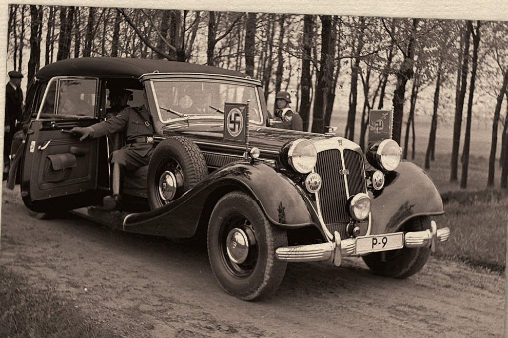
Služební vůz prvního říšského protektora.

Na podzim roku 1945 Neurath stanul na lavici obžalovaných v norimberském soudním procesu s předními nacistickými válečnými zločinci. Soud uznal jeho vinu a poslal ho na 15 let do vězení. Trest si odpykával ve speciální věznicí pro válečné zločince v berlínském Spandau. V roce 1954 byl propuštěn ze zdravotních důvodů (jako osmdesátiletý). Krátce nato, 14. srpna 1956, zemřel v německém městě Enzweihingen.