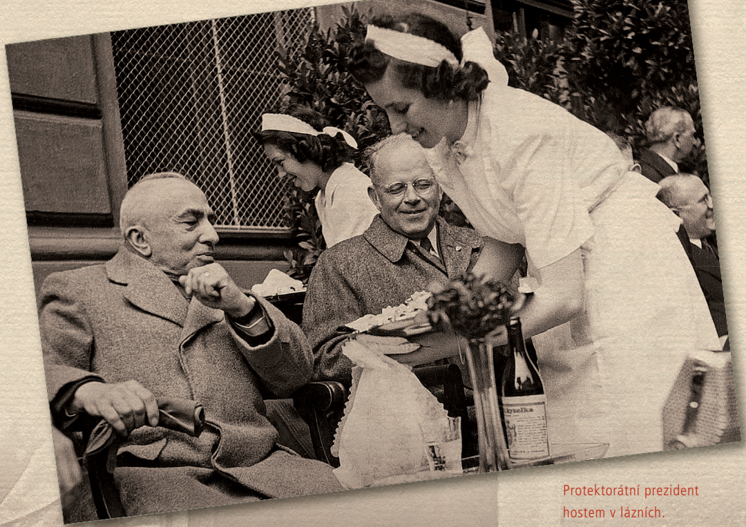
Protektorátní prezident hostem v lázních.