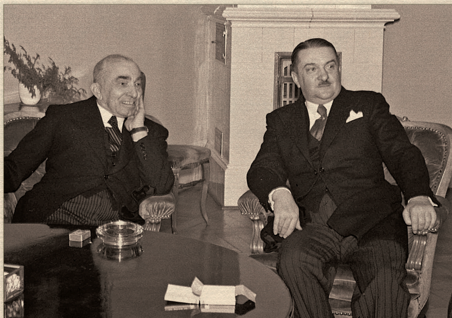
Nejvýše postavení představitelé české části protektorátní správy před 28. září 1941: prezident Hácha (vlevo) a předseda vlády Eliáš společně čekají na příchod Nového roku 1941.

Protektorátní rozhlas ještě téhož dne tlumočil první nařízení nového vládce: „ Vyhlašuji na ochranu zájmů říše s účinností od 28. září 1941 dvanácti hodin až na další na území Protektorátu Čechy a Morava civilní stav výjimečný. Všechny činy, jimiž jsou porušovány veřejný pořádek, hospodářský život nebo pracovní mír, jakož i nedovolené chování střelných zbraní, traskavin nebo střeliva, podléhájí stannému právu. To se týká také všeho srocování, shromažďování v uzavřených místnostech i na veřejných ulicích. Proti rozsudkům stanných soudů není odvolání. Rozsudky se vykonávají ihned zastřelením nebo oběšením. Podepsán: Heydrich. “ Okamžitě se spouští vlna zatýkání. V Praze a Brně zasedají stanné soudy. Jejich řízení je zkráceno často jen na několik minut. Stanné právo se totiž obejde bez dokazování i bez obhajoby. Pouze se předčítají jména zatčených