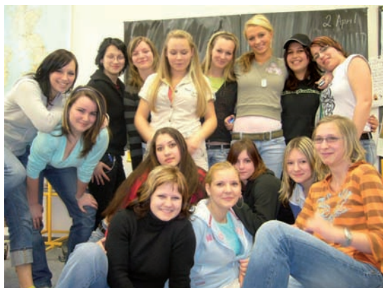
Holky ze střední na hodině angličtiny.