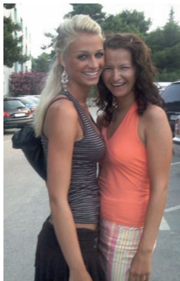
Hanička a já