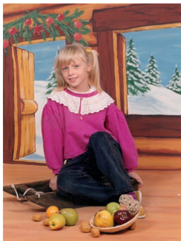
2. třída, 8 let. Školní foceň, tu fotku jsem měla moc ráda.