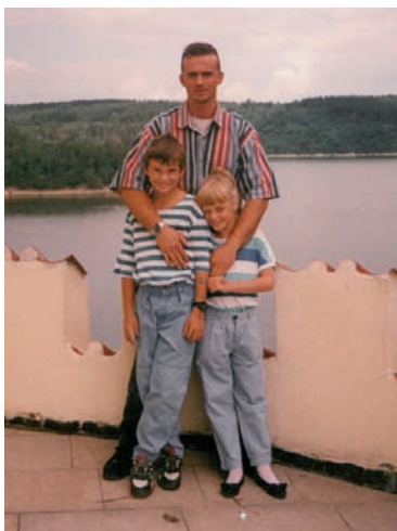
S tatínkem na výletě na Orlické přehradě, 8 let. Moje nejmilejší fotografie s tátou.