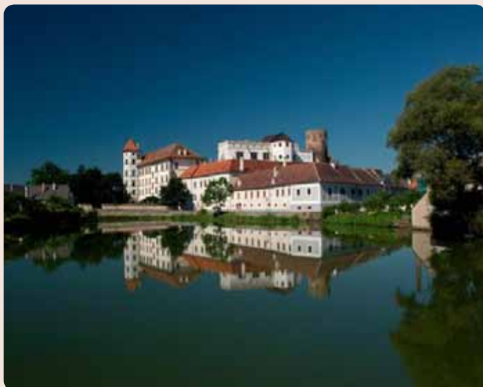
Přestavbou původního hradu vyrostl zámek v Jindřichově Hradci.

Na státním hradu a zámku najdete také Muzeum Československé armády 1938 , mapující mobilizaci v září roku 1938, boj se záškodníky, výzbroj a výstroj armády, vidět můžete maketu celního úřadu, model „řopíku“ i s vybavením, dobového tábořiště vojáků, přehled předválečné produkce kulometů brněnské Zbrojovky. S řadou vystavených exponátů je možné manipulovat a na místě vyzkoušet. Otevřeno je v červenci a srpnu denně, v květnu, červnu a září o víkendech a svátcích.