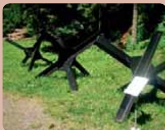
Protitankové překážky (ocelové nebo železobetonové) doplňovaly linie opevnění.