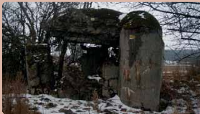
Objekt lehkého opevnění poškozený Němci u hřbitovního kostela ve Strmilově