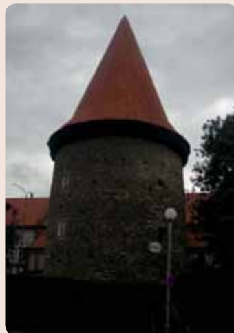
Baštu městského opevnění, sloužící dnes jako penzion, najdete v Českém Krumlově u pivovaru.