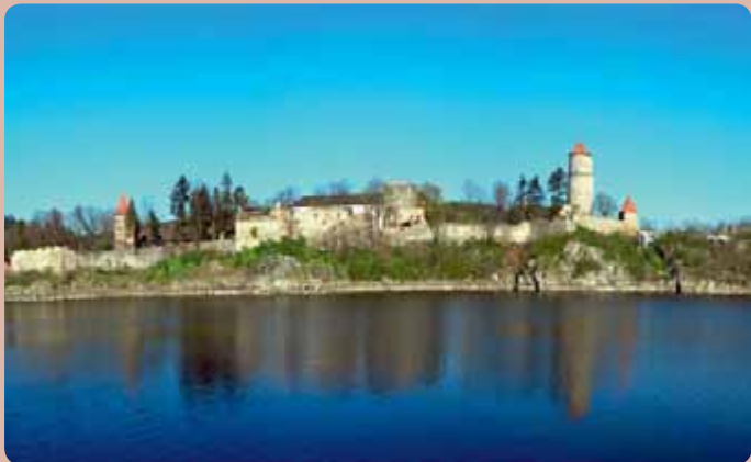
Vzedmutá hladina Orlické přehrady pohltila i část opevnění a hlavní přístupové cesty na hrad Zvíkov.