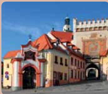
Písecká brána v Prachaticích

V Prachaticích můžete navštívit expozici Národního muzea věnovanou historii loutkářství a cirkusu ( www.nm.cz ).