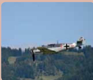
V Leteckém muzeu v Deštné najdete i fragmenty ze sestřeleného letounu Messerschmitt Me-109.