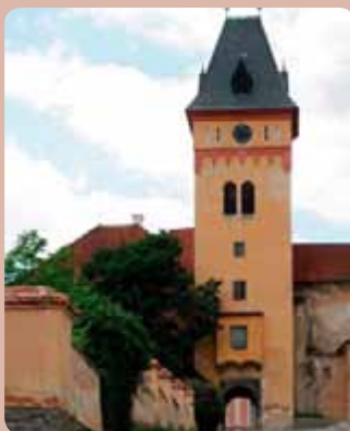
Hradní věž ve Vimperku