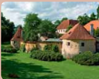
Přestože se ani Třeboň nevyhnula boření hradeb, zachované úseky stojí za prohlídku.

U rybníka Svět můžete navštívit novogotickou Schwarzenberskou hrobku (www.zamek-trebon.eu/hrobka-schwarzenberku/).