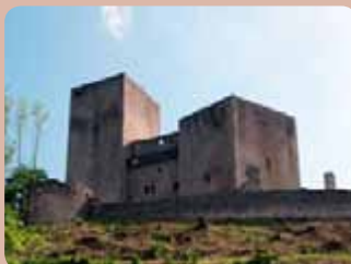
Landštejn, mohutně opevněný hrad, střežil hranici Čech, Moravy a Rakouska.

E-mail: landstejn@budejovice.npu.cz www.hrad-landstejn.cz