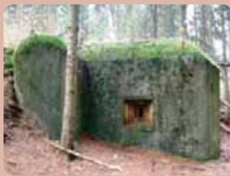
Nejčastěji budované objekty lehkého opevnění – „řopíky“ – mají své pojmenování odvozené od zkratky Ředitelství opevňovacích prací – ROP.

Naše linie opevnění z třicátých let měla své silnější i slabší stránky. Mezi ty první patří vynikající kvalita provádění prací. Při betonáži „řopíků“ s běžnou odolností měla krychelná pevnost betonu dosahovat hodnoty 450 kg/cm 2 , tato hodnota byla nejen dodržena, ale například právě z Šumavy pochází rekordní kontrolní vzorek, který se vyšplhal až na 741 kg/cm 2 . Kromě řady dalších problémů u linie lehkého opevnění by byla obrana zkomplikována tím, že v roce 1938 armáda dosud neměla ve výzbroji vhodné obranné granáty, nepodařilo se spolehlivě dořešit spojení a na Šumavě chybělo opevnění u některých komunikací. Navíc dobře vyzbrojená německá armáda měla o opevnění dobré informace a připravovala se na útok v nejslabších místech.