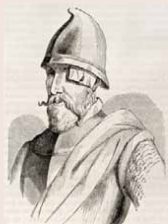
Jan Žižka z Trocnova

V Trocnově stály původně dva dvorce – Mikšův a Žižkův. Po archeologických průzkumech jsou rekonstruovány půdorysy dvorců, najdete zde Žižkův dub, pod nímž se údajně vojevůdce narodil, pomník ze žulových kamenů, nad loukou velký žulový pomník. Navštívit můžete Památ-ník Jana Žižky s expozicí věnovanou vojevůdci i archeologickým nálezům na místě. Otevřeno je od května do září denně mimo pondělky.