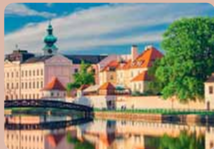
Dochovaná část městského opevnění Českých Budějovic

Nádherný výhled na město a okolí vám poskytne ochoz Černé věže, původně sloužící jako hláška a zvonice ( www.kudyznudy.cz/Aktivity-a-akce/Aktivity/Dominantni-Cerna-vez-v-Ceskych-Budejovicich.aspx ).