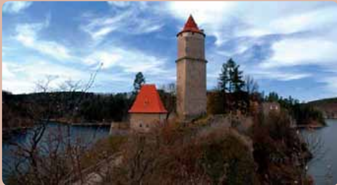
Náš nejznámější, raně gotický hrad Zvíkov