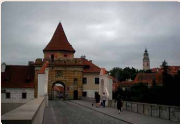
Budějovická brána v Českém Krumlově