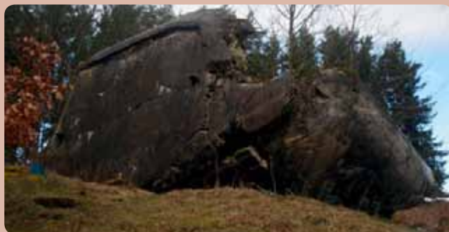
Při odstřelu se tento řopík celý prakticky nepoškozený převrátil, což svědčí o vynikající kvalitě opevnění. Najdete ho u rybníka Komorníku u Strmilova.