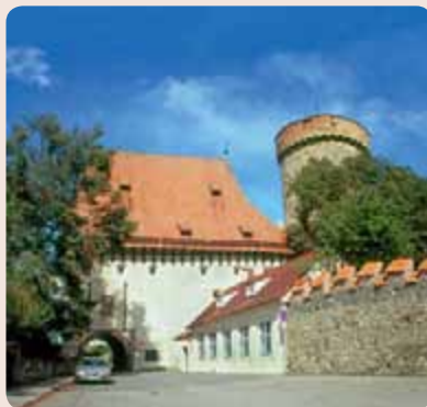
Brána a hradní věž Kotnov v Táboře

obdivovat. V třicátých letech 15. století došlo k jeho dalšímu zdokonalení, z té doby pochází trojbrání Nové brány, soustava tří bran s prostorem mezi nimi čelně chráněným mohutnou, několikrát zalomenou zdí se střílnami, jeden z prvních barbakanů Evropy. Městské hradby tvořil systém parkánové a hlavní hradby doplněný věžemi a baštami, dodnes je zachovaná Žižkova bašta zvaná Velká.