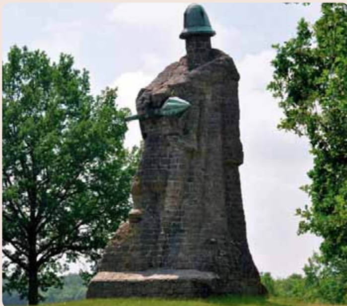
Z dálky viditelná Žižkova mohyla u Sudoměře

Prvního velkého vítězství, navíc proti značné přesile, dosáhli husité neda-leko jihočeské Sudoměře. Houf asi 400 bojovníků táhl z Plzně k Táboru. Pronásledovalo jej asi 700 až 2.000 jízdních těžkooděnců. Na hrázi mezi