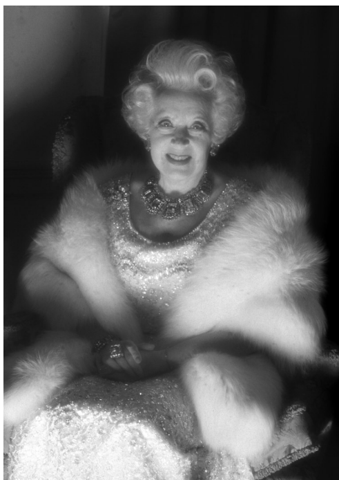
Barbara Hamilton Cartlandová