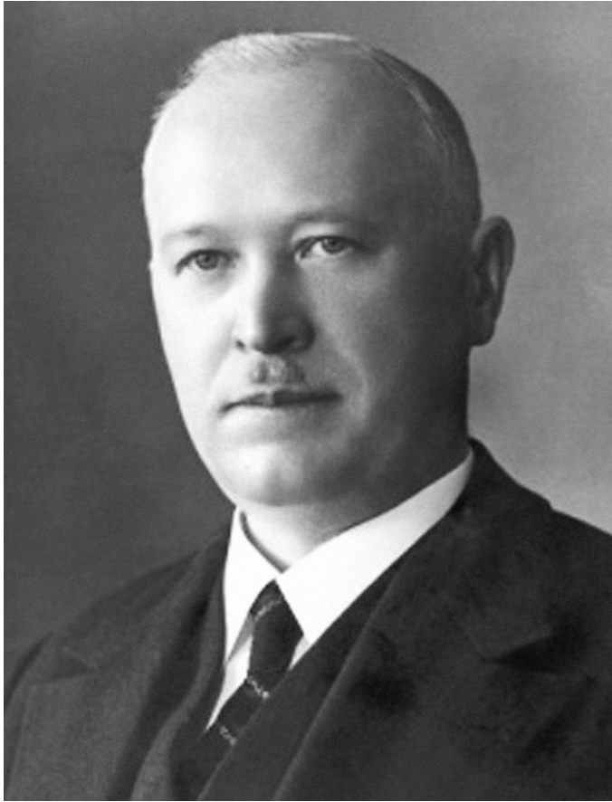
Josef Lukeš, klasický filolog a ředitel gymnázia, popravený v roce 1942, byl předobrazem latináře Málka ve filmu Vyšší princip (1960).