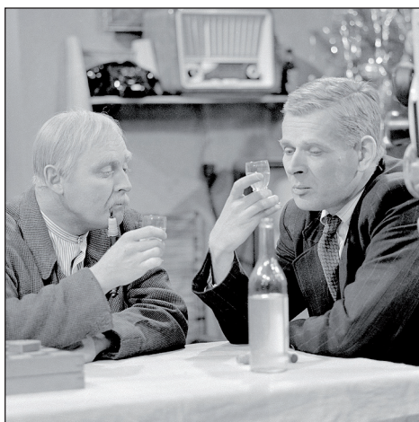
Děda Potůček vychovává svého syna...