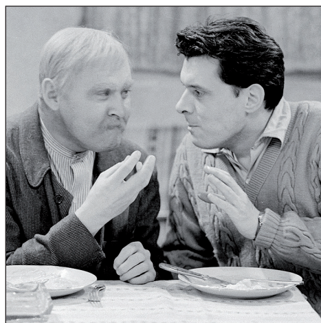
... svého vnuka...