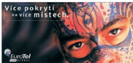
■ Kreativní tým agentury Leo Burnett pod vedením Cala Brunse vytvořil EuroTelu svébytnou tvář.