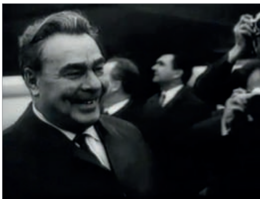
■ Reklama SPT Telecom nazvaná Minulost už nezměníme – teď měníme zítřek vznikla v témže roce, kdy odstartoval Paegas, v roce 1996.