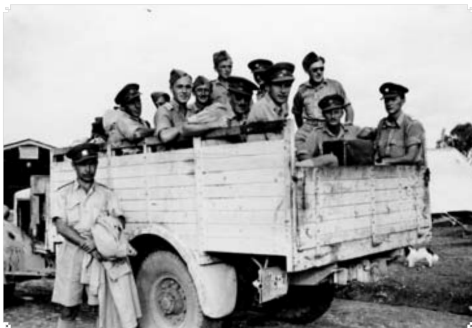
▲ Odjezd letecké skupiny aspirantů z Beisan na Středním východě do Anglie.