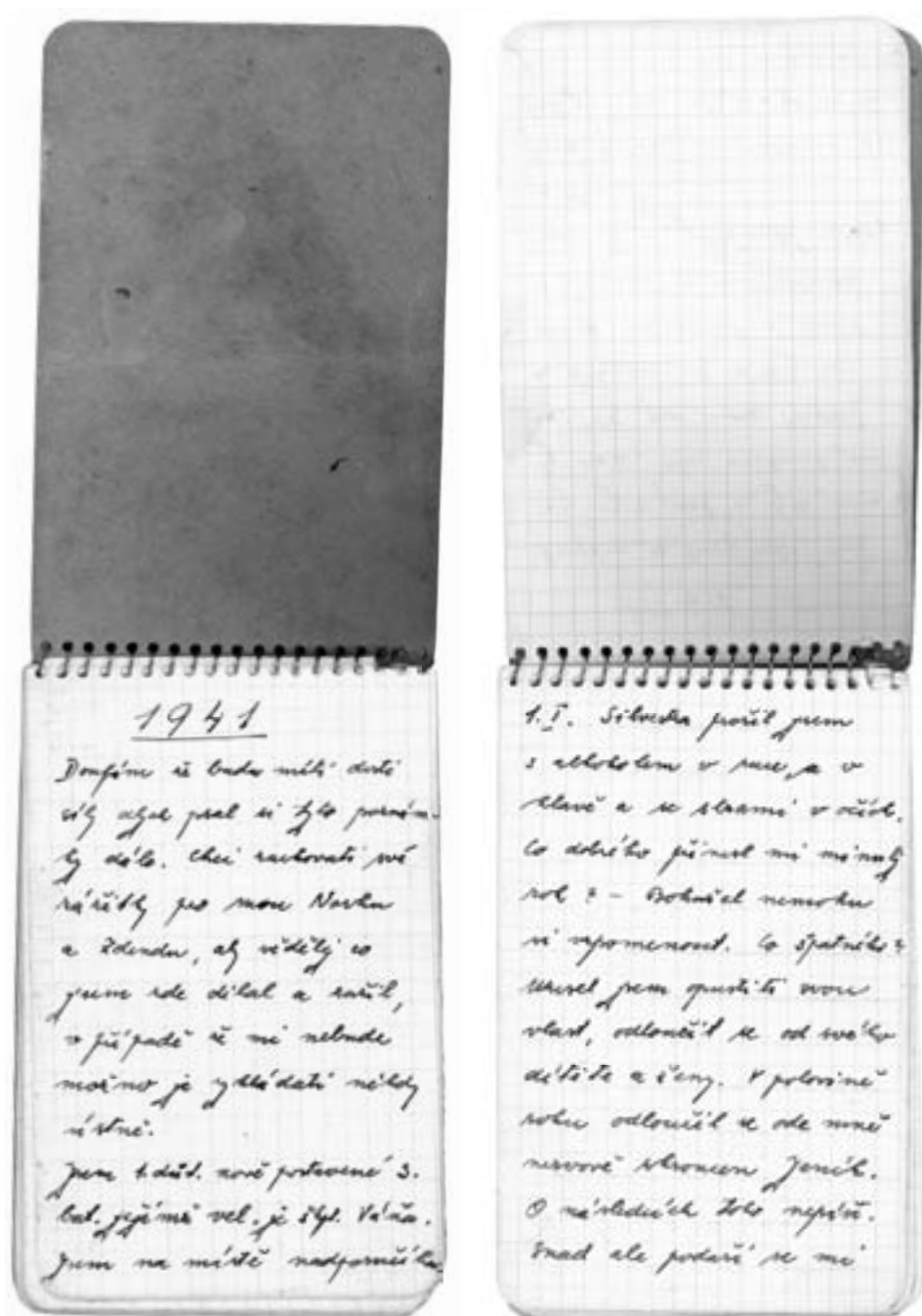
▲ 1. a 2. strana 2. deníku.