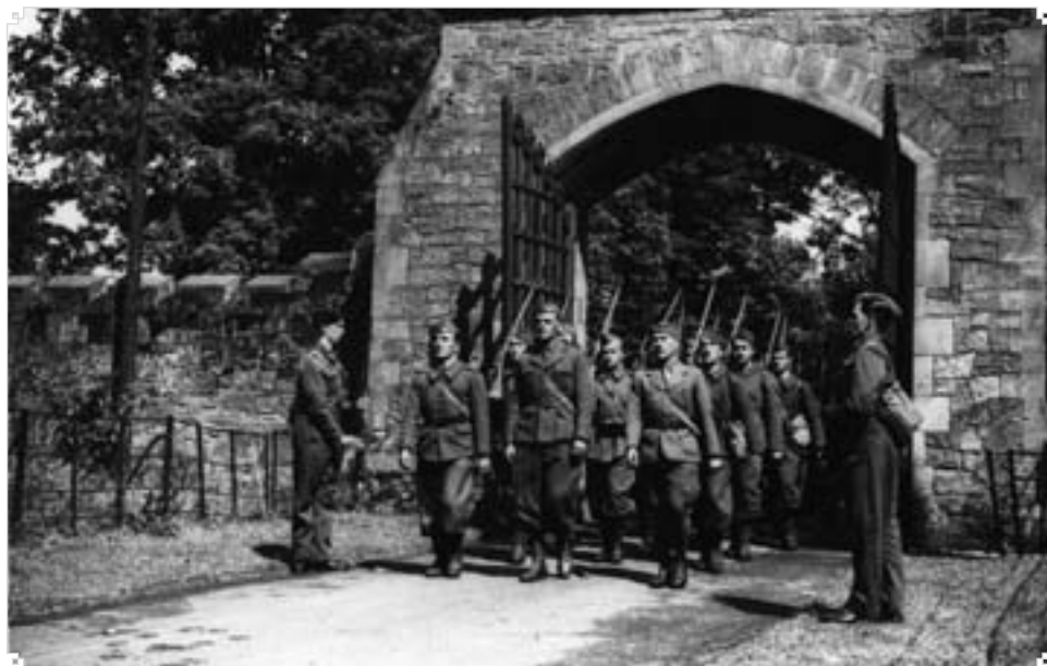
▲ Čs. samostatná brigáda v Cholmondeley Park.