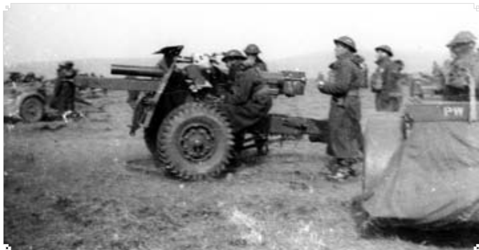
▲ Cvičení československých dělostřelců v roce 1941 na střelnici v Anglii.