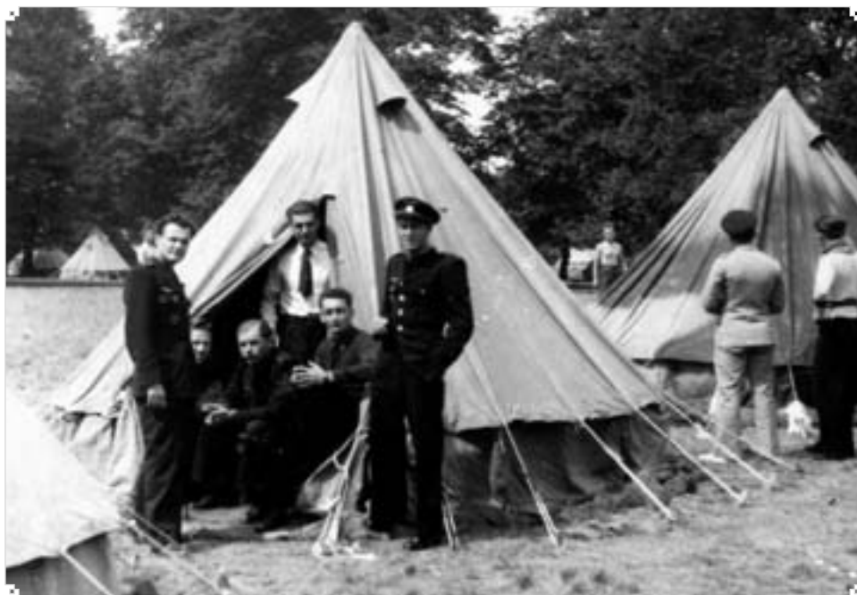
▲ Českoslovenští vojáci.