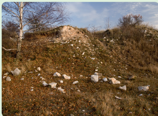
▲ Okraj staré pískovny s výskytem křemenců bečovského typu