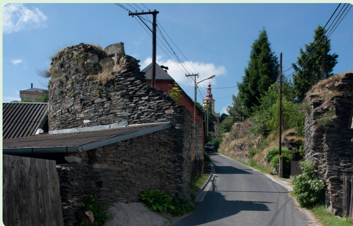
▲ Zbytky Dolní brány, součásti městského opevnění Rabštejna nad Střelou

Nedaleko mostu si můžete při cestě po turistické značce proti proudu Střely všimnout stěn starých lomů, pod kterými leží v sufovisku pláty tenkého, tmavého a snadno štípatelného kamene. Jde o pokrývačskou břidlici, která se na Manětínsku v minulosti těžila a používala se především jako střešní krytina.