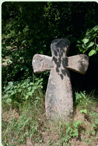
▲ Smírčí kříž z roku 1584 v ulici nedaleko mostu. Smírčí kříže byly obvykle budovány jako součást pokání za spáchaný násilný čin.

bylo zcela zaslouženě zařazeno mezi městské památkové zóny. Stojí tu celá řada roubených a hrázděných domů a navíc i pozůstatky gotických hradeb a městské brány. Zajímavý je rovněž most přes Střelu, který stojí na dolním okraji města. Byl postaven v letech 1738–1748, měří 65 m a má šest oblouků.