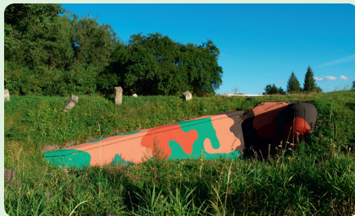
▲ U Bratronic bylo potřeba palebně pokrýt obě strany silnice. Namísto dvou pevnůstek ale stačilo vystavět jen jednu originálně řešenou.