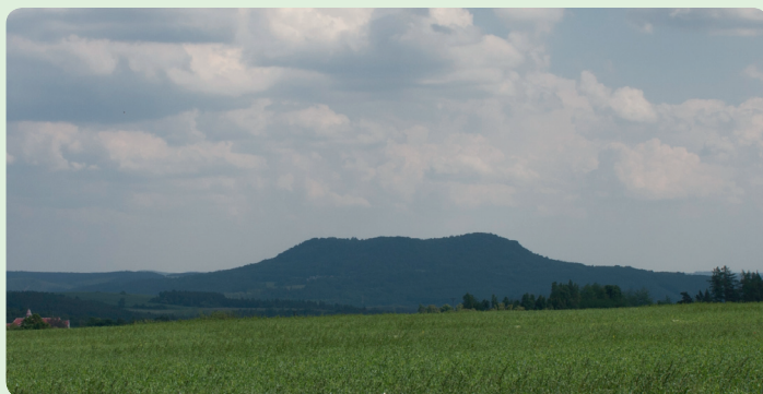
▲ Stolová hora Vladař

Do podzemí Žlutic se v současnosti podíváte právě v rámci prohlídky muzea, které sídlí v měšťanském barokním domě na náměstí. V muzeu, i když nikoliv přímo v podzemí, je také mimo jiné vystaven 32 kg těžký Žlutický kancionál z roku 1565, jehož desky mají rozměr 46 × 43 cm. Velké rozměry knihy nebyly samoúčelné, protože se používala jako zpěvník při sborových vystoupeních v kostele a bylo třeba, aby všichni zpěváci dobře viděli na text.