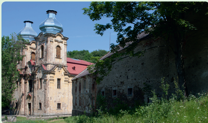
▲ Málokdo už dnes ví, že zvolání „Panenko skákává!“ se vztahuje právě k Mariánským Skokům

zřícenin, například níže položeného Doupovského mlýna, méně zarostlá, neboť uvnitř byla donedávna vestavěna trampská chata. Posledním přístupným zříceným mlýnem je Rohra Mühle, který stojí severně od vrchu Čerták, na kraji louky u značené cesty. I k němu patří starý náhon a nedaleko proti proudu se z řeky tyčí kamenný pilíř zříceného mostu. Zbytek údolí je již zatopen vodní nádrží Žlutice.