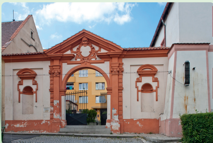
▲ Brána bývalého žlutického zámku, který vyhořel v roce 1761, dnes vede poněkud nezvykle k moderním obytným domům

Nedaleko Žlutice se tyčí nepřehlédnutelná stolová hora Vladař. Na jejím vrcholu stálo v pozdní době halšatské jedno z nejvýznamnějších hradišť v západních Čechách. Kromě samotných mohutných valů, které v sobě uzavírají plochu o rozloze 116 ha, zde najdete i jeden technický unikát – umělou pravěkou nádrž o rozměru 45 × 30 m, která sloužila obyvatelům hradiště jako cisterna k zásobování vodou. www.vladar.cz , www.kar.zcu.cz/ovp/projekt.php?id=17