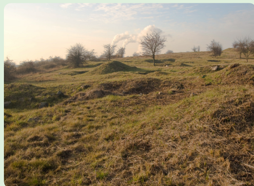
▲ Písečný vrch je zbrázděný různě starými těžebními jámami

byl v té době opracováván přímo na místě. Na konci poslední doby ledové se zde zase mimo jiné vyráběly vysoce kvalitní dlouhé čepelové nože, které byly nalezeny až v Durynsku.