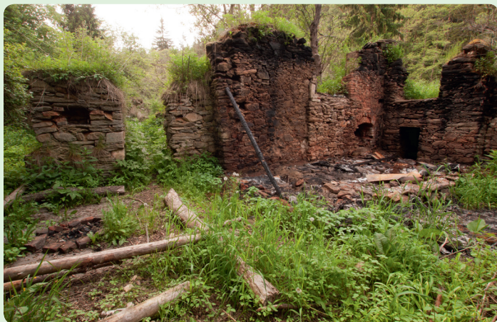
▲ Pozůstatky Tomšovského mlýna