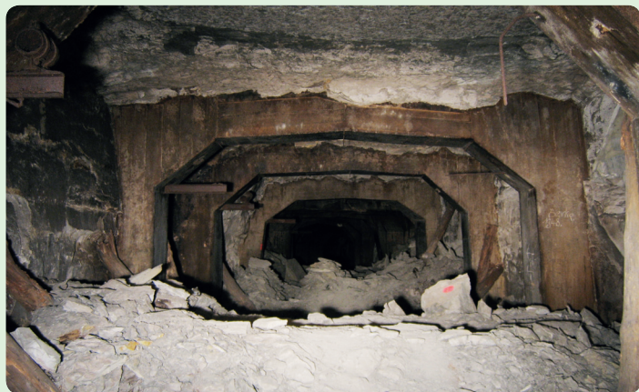
▲ Nacisté při rozšiřování chodeb využili podzemí dolu Richard betonovými nosníky, ale tlaky v hornině postupně trhají i je. Ze stropů se navíc odlupují velké kamenné desky přezdívané „víka na rakve“.