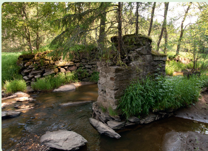
▲ Zbytky mostu pod Čerťákem. Vydáte-li se údolím Střely mimo značené cesty, připravte se na časté brodění.

Následující částí údolí Střely už značky nevedou, část budov u tří mlýnů, které tu stávaly, slouží jako rekreační stavení. Zbytky dalšího náhonu je možné vyzorovat u Kozlovského mlýna, který stával u potoka severozápadně od vrchu Mašličky. Ruina následujícího Tomšovského mlýna, která už leží u značené Skokovské stezky, je na rozdíl od ostatních podobných