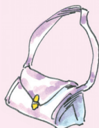
(käsi)laukku [kæsila:uk:u] kabelka