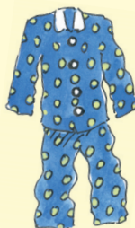
pyjama [püjama] pyžamo