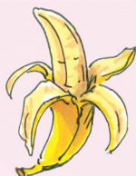
banaani [bana:ni] banán