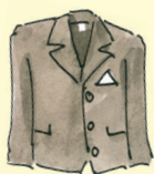
pikutakki [pik:utak:i] sako