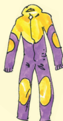
haalarit [ha:arit] kombinéza