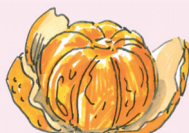
mandariini [mandari:ni] mandarinka