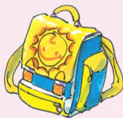
laukku [lau:ku] aktovka