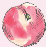
persikka [persi:ka] broskev