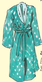
aamutakki [a:mutak:i] župan