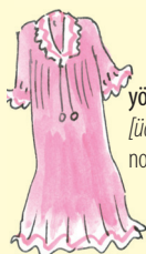
yöpaita [üöpaita] noční košile