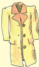
syystakki, kevättakki [süstak:i, kevættak:i] plášť