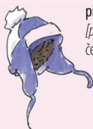
piipo [pi:po] čepice