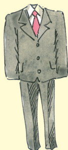
miesten puku [miesten puku] oblek muž.