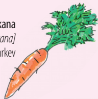
porkkana [pork:ana] mrkev