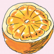
appelsiini [ap:elsi:ni] pomeranč