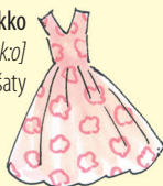
mekko [meko] šaty