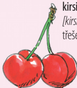
kirsikka [kirsik:a] třešeň