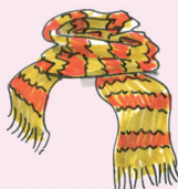
kaulaliina [kaula:li:na] šála