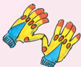
käsineet [kæsine:t] rukavice