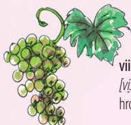
viinirypäle [vi:niri:pæle] hroznové víno