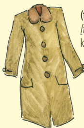
(talvi)takki [talvitak:i] kabát