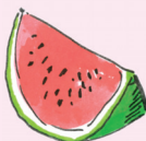
meloni [meloni] meloun