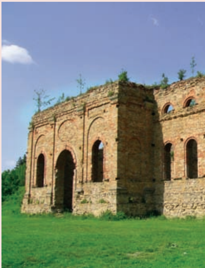
▲ Technická pamiatka Františkova huta.

región mala veľký význam v počiatkoch industrializácie. Ak sa rozhodnete navštíviť hutu dnes, ovanie vás nádych éry priemyselnej revolúcie. Františkova huta je zachovaná iba ako zrúcanina, no uvidíte tu pôvodnú vysokú pec, prírodný a odpadový kanál, dýchadlovú komoru, ako aj ďalšie zvyšky častí hámra. Určite najzaujímavejšou je vysoká pec s komínom a množstvom vetracích otvorov. Františkova huta si stále, aj napriek nepriaznivému stavu, zachováva svoju dôstojnosť a čaká na nové využitie.