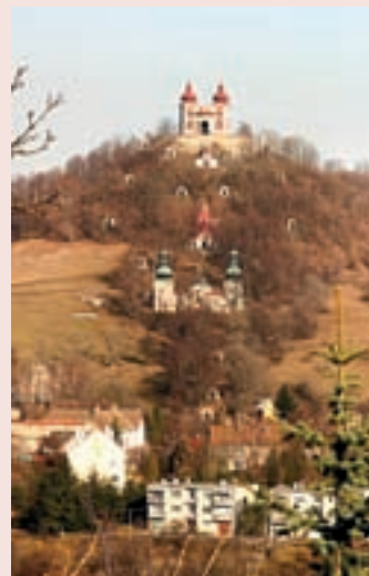
▲ Charakteristický pohľad na Banskoštiavnickú kalváriu.

Banskoštiavnická kalvária je výnimočné miesto, ktoré má nesmierne silné „genius loci“. Nezáleží na tom či ste veriaci alebo nie, v každom dokáže navodiť vyrovnanú atmosféru a pocit harmónie. Jej jedinečnosť potvrdzuje aj fakt, že spolu s mestom a bankskými technickými pamiatkami sa dostala do zoznamu svetového a prírodného dedičstva UNESCO.