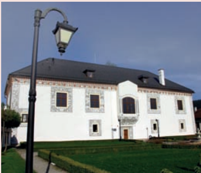
▲ Renesančný sobášny palác v Bytči.