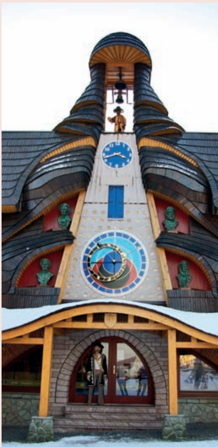
▲ Originálny orloj v Starej Bystrici.

Orloj v Starej Bystrici nie je jedinou nezvyčajnou stavbou na námestí. Celé námestie bolo totiž prestavané na tzv. Rínok sv. Michala . Premenou prešli budovy obecného úradu a základnej školy, pribudla Zbojnícka bašta s obchodmi a reštauráciou. Nechýbajú lavičky, upravená zeleň ani informačná kancelária s predajom suvenírov. Celý projekt je naozaj vydarený a jeho komplexnosť vytvorila výnimočné a originálne miesto.