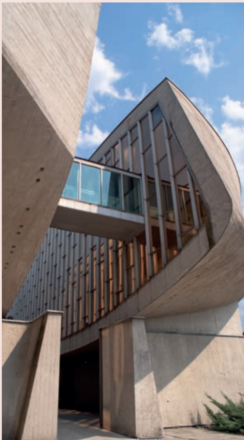
▲ Pamätník a múzeum SNP v Banskej Bystrici.

Celý koncept umocňuje dlhé vonkajšie schodisko ústiace do priestoru „štrbiny“, v ktorej je umiestnená plastika od sochára Jozefa Jankoviča s názvom Obete varujú . Plastika vyjadruje utrpenie človeka a padlých bojovníkov. Počas normalizácie bola pre jej nejednoznačný význam dokonca odstránená. Na svoje miesto sa vrátila až v roku 2004. Pamätník SNP je naozaj výnimočnou stavbou s nadasovými morálnymi aj architektonickými hodnotami.