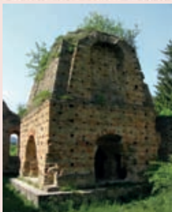
▲ Vysoká pec Františkovej huty.