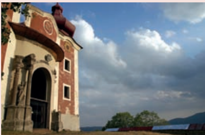
▲ Horný kostol Banskoštiavnickej kalvárie.