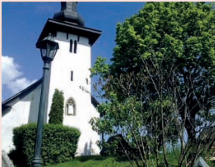
▲ Kostol sv. Martina v Martinčeku.

okolo kostola. Miestni ich volajú „dášky“ a prekrývajú 3 – 5 metrov hlboké jamy na uskladnenie úrody. Celkový pohľad na kostol tak nabere nezvyčajné črty a pôsobí akoby bol vystrihnutý z rozprávkového sveta.