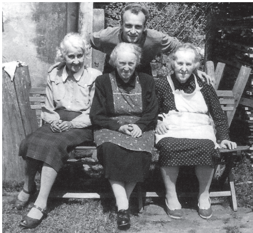
Maminka s tetami Máňou a Fanynkou

ručně pomocí vytloukácké desky, později na vytloukáckém stroji. Pro každý vzor musela být nová karta. Karty pak šly do textilních fabrik, ve kterých podle jejich dírkování tkali vzorované látky na nábytkové potahy, povlaky na postele, ubrusy a podobně.