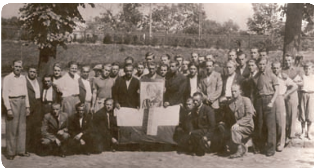
Nová skupina dobrovolníků po příjezdu do Krakova v polovině srpna 1939. S polskou vlajkou, československou trikolórou a portrétem polského prezidenta Ignace Mościckiho.