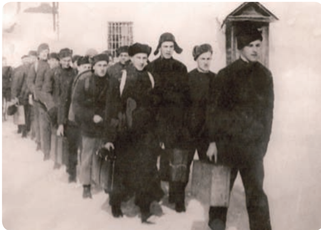
Skupinka Čechoslováků opouští Suzdal. Pravděpodobně koncem zimy roku 1941.

Sovětská strana nechtěla odeslat Čechoslováky na Západ, aby tam bojovali proti nacistům,