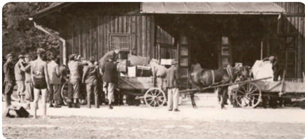
Příjezd nových branců do tábora v Malých Bronovicích u Krakova. 14. srpen 1939. V té době jednotka stále ještě neměla oficiální status.

V období tzv. pražského jara v roce 1968 ho reformní vedení země prosadilo na post prezidenta. Veřejnost k němu vzhlížela s nadějemi („Se Svobodou za svobodu!“ říkalo se tehdy). Nakonec se do historie Československa zapsal jako normalizační prezident (úřad zastával v letech 1968 až 1975). Proti sovětské okupaci 21. srpna 1968 nevystoupil, což pro společnost představovalo velké zklamání. Jako jediný prezident v československé historii byl z funkce „odvolán“ přijetím zvláštního ústavního zákona, který ho ze zdravotních důvodů zbavil funkce (odmítal totiž na nátlak G. Husáka odstoupit).