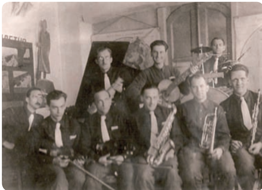
Dlouhé měsíce čekání v Suzdalu si internovaní Čechoslováci krátili sportovními a kulturními aktivitami.

Československému útvaru hromadná poprava v SSSR nehrozila, mimo jiné i s ohledem na přetrvávající dobré vztahy mezi československou emigrací v Londýně a sovětskými představiteli.