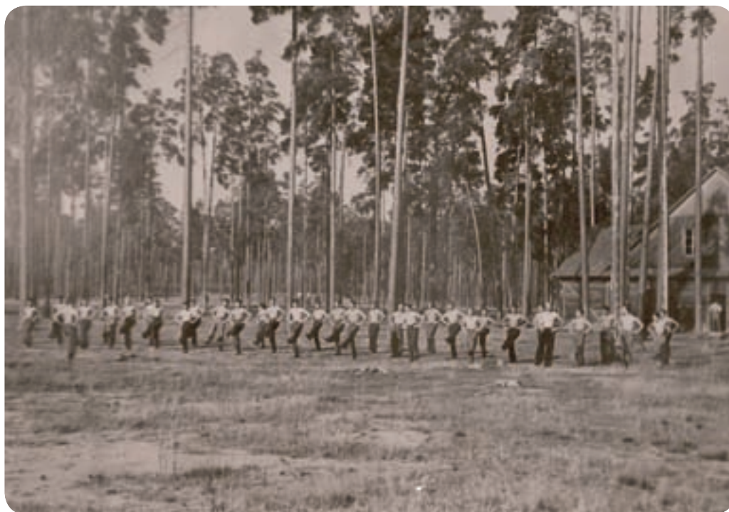
Ranní rozcvička v Lešné. Tábor obklopovaly borovicové lesy vyrůstající z písčité zeminy. Ideální terén pro vojenský výcvik.

Ráno 17. září se nad městečkem Hluboczek Wielki objevilo devět bombardérů se slovenskými výsostnými znaky na křídlech. Příslušníci československého legionu je mylně považovali za Slováky bojující v řadách polského či sovětského letectva. Vystoupili z úkrytů a přátelsky mávali na slovenské piloty. Ti však na městečko vzápětí spustili bomby. Slovenský nálet na Hluboczek Wielki si vyžádal několik obětí, avšak Čechoslováci mezi nimi nebyli.