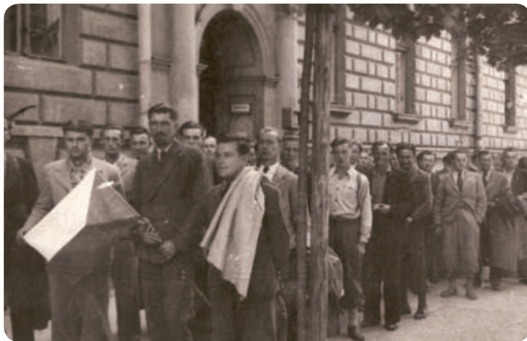
Zástup československých dobrovolníků před konzulátem v Krakově.