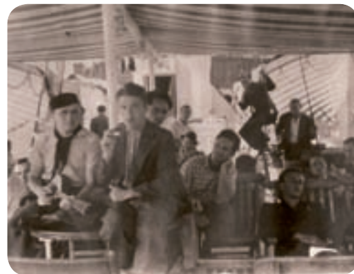
554 československých dobrovolníků na palubě lodi Boleslav Chrobry, která je v červnu 1939 přepravila z Polska do Francie. Dopravu hradila francouzská vláda pod podmínkou, že Čechoslováci ve Francii vstoupí do Cizinecké legie.