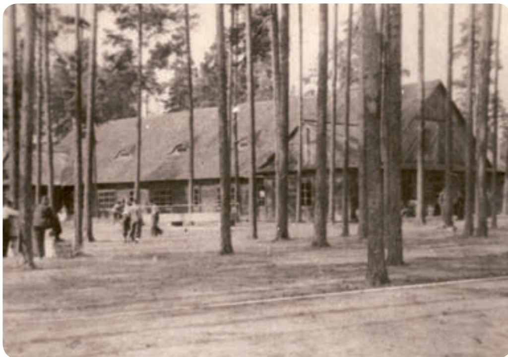
„Tábor československých dobrovolníků“ v Lešné po vypuknutí války. Šest stovek Čechoslováků se v něm zdržovalo v období mezi 1. a 11. září 1939.