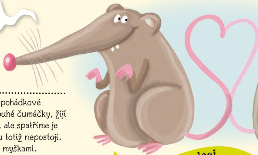
Páří se rejsci

Rejscí vypadají jako pohádkové postavičky. Mají dlouhé čumáčky, žijí v zahradách i lesích, ale spatříme je jen zřídka. Chvilíčku totiž nepostojí. Často si je pleteme s myškami.