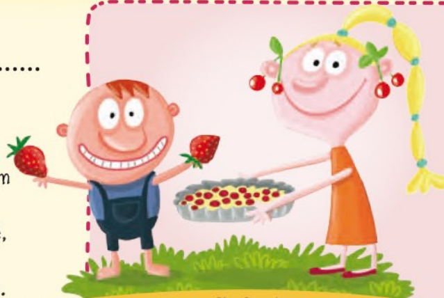
Zrají třešně a jahody

Podívejme se, co to tu zraje. Jahody! Ty nejčervenější jsou nejsladší. Šup s nimi do koláče! Nebo že bychom si natrhali třešně? Vrabec i pěnkava mezitím vesele poskakují po zahradě. „Konečně léto!“ zaradovalo se slunéčko sedmítečné, když zjistilo, že je 21. června. Roztáhlo krovky a odlétlo vstříc horkému sluníčku.