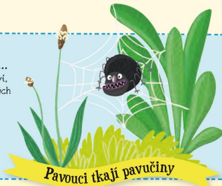
Pavouci tkají pavučiny

Pavouci jsou možná oškliví, ale velmi užiteční. Do svých sítí chytají nejrůznější hmyz. Berou všechno, co jim uvízne v síti, třeba otravné komáry.