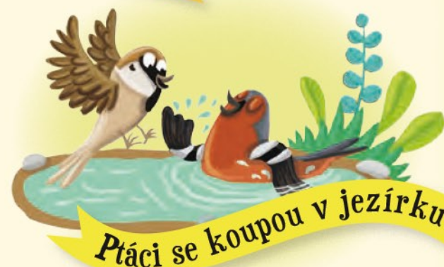
Ptáci se koupou v jezírku

Měsíček lékařský je dobrý na rány, které se špatně hojí. Teď v červnu krásně kvete! Zahradní trpaslík ho pozoruje s neutuchajícím úžasem už od jara.