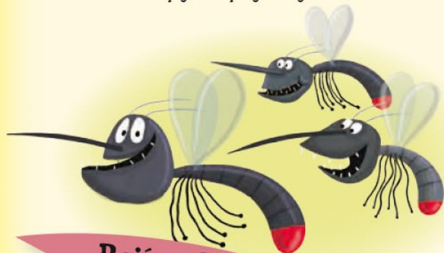
Rojí se komáři

To si zase pochutnáme! V červenci a srpnu zraje rybíz. Podívej, z rostlinky na rostlinku se spouští pavouček na tenkém vlákně. Tká pavučinu. Pavučinová vlákna vypadají křehce, a přitom něco vydrží! Brzy ráno se v nich třpytí kapky rosy.